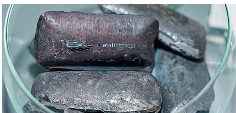
▲ Компания представила на витринах продукцию, востребованную в Узбекистане и других странах Центральной Азии