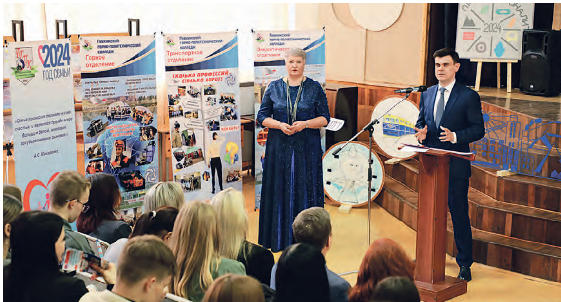
▲ На прошлой неделе Лебединский ГОК подписал трёхстороннее соглашение об участии в федеральном проекте «Профессионалитет» с представителями Губкинского горно-политехнического колледжа и министерства образования региона

Конечно же, продолжим повышать благосостояние наших работников, развивать социальные объекты и программы, связанные с кадровой устойчивостью. Уже сегодня задумываемся о реализации жилищной программы. Уверен, что коллектив Лебединского ГОКа останется таким же сильным, компетентным, сплочённым, способным решать самые амбициозные задачи. Это будет очень серьёзная шестилетка, напряжённая и ударная. Мы справимся.