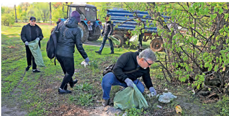
▲ Мусорить стали меньше. Но работы участникам субботника по-прежнему хватает