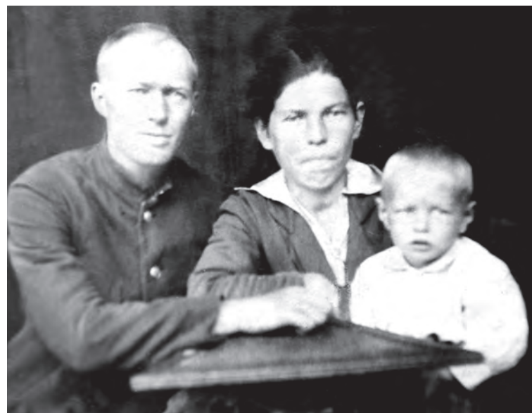
▲ Старые фотографии — напоминание не только о родных, но и о разрушенном войной детстве