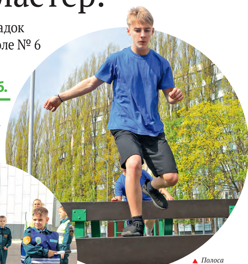
▲ Полоса препятствий