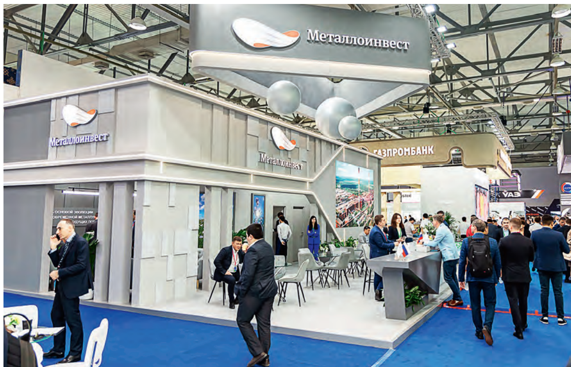
▲ Павильон Металлоинвеста вызывал всеобщий интерес

Металлоинвест постарался максимально полно использовать возможности выставки.