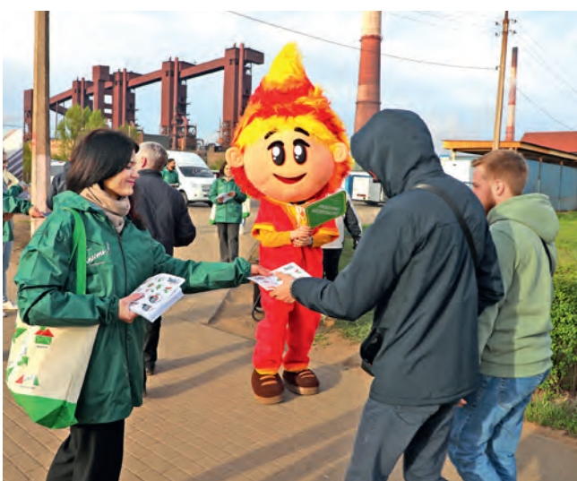
▲ Металлургов встречала весёлая Искорка

Работникам ОЭМК снова напомнили об охране труда — прямо на проходной комбината.