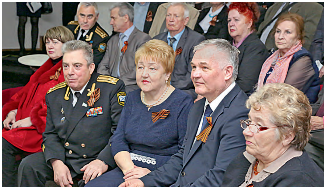
Уже более 15 лет фонд «Поколение» депутата Госдумы Андрея Скоча поддерживает крепкую дружбу и сотрудничество с региональным Советом ветеранов Белгородской области.