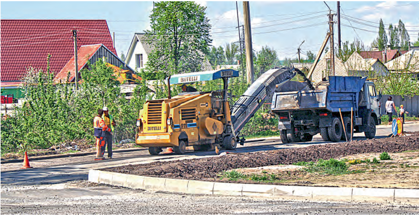
До начала лета должен быть завершён ямочный ремонт более 5,3 тысячи квадратных метров дорожного полотна.