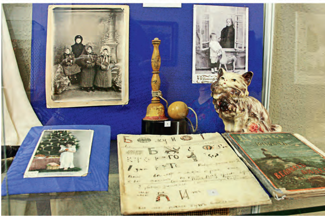
Вверху: вид с колокольни Крестовоздвиженского храма в Ямской. Внизу: одна из витрин.

ремесленного Старого Оскола. Здесь же, в двух выставочных залах краеведческого музея, нас ждёт совсем другой Оскол — реальный и в то же время поэтический, вполне материальный, фактурный, осязаемый, но в чём-то литературно-образный, лиричный. Здесь вы окупаетесь в купеческий быт, почувствуете дыхание серебряного века, вспомните дореволюционные мелодии, глядя на старый патефон, задумаетесь на мгновение, что когда-то у вашей бабушки было именно такое вот платье, в котором, возможно, она танцевала на выпускном, а плюшевый медведь, возможно, до сих пор пылится на чердаке. Многочисленные предметы быта горожан, галантерейные товары, парфюмерная продукция, коллекция тканей середины XX века, документы, письма, денежные банкноты, интересные групповые фотографии и портреты жителей из фондов музея органично сопровождают коллажи.