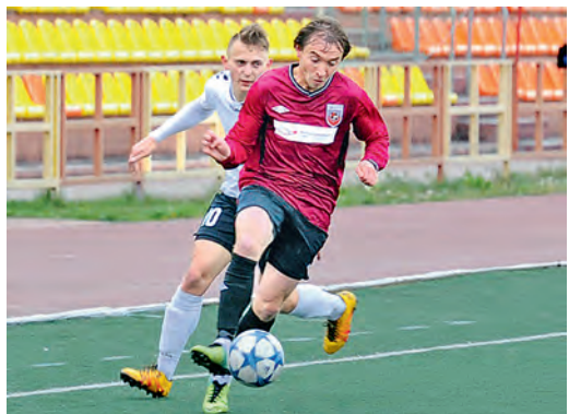
Дебют острее получился у металлургов.