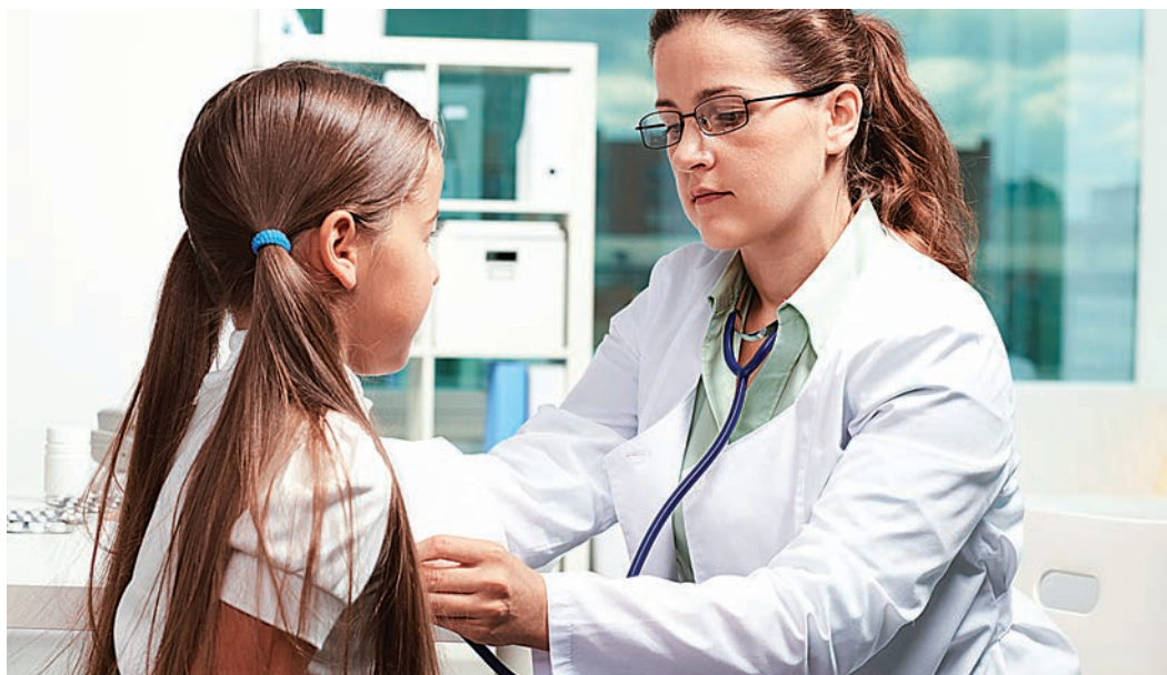
Укомплектованность врачами медицинских организаций округа в 2014 году составляла всего 62 процента.

Дошкольным образованием охвачено 72,5 процента детей в возрасте от полутора до семи лет, причём наибольший охват наблюдается в отношении тех, кому уже исполнилось пять лет. По уверениям властей, мест в детсадах больше, чем желающих. Однако наблюдается недостаток мест по территориальному признаку, а также сложности в устройстве в ясельные группы. Для повышения доступности услуг дошкольного образования в 2014 году построено два детских сада — в сёлах Архангельское и Озёрки. Только на их оборудование ушло почти 2,5 млн рублей, но зато благодаря открытию и оптимизации наполняемости групп было создано 270 дополнительных мест. С теми же целями на базе четырёх школ округа (в сёлах Владимировка, Монаково, Песчанка и Ивановка) функционируют дошкольные группы. На капремонт и строительство детских садов и школ направлено 78 млн 862 тысячи рублей, из них 40 млн — из федерального бюджета.