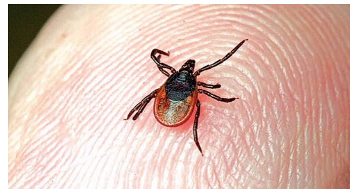
В прошлом году от укусов клещей пострадало 548 человек.

есть не всегда, так что следует заранее позаботиться о подходящей одежде. Лучше всего подойдут брюки, куртка или рубашка, закрывающая руки и шею, головной убор, закрытая обувь. Если вы всё-таки обнаружили уже присосавшегося клеща, то необходимо обратиться за помощью в лечебно-профилактическую организацию, где смогут правильно удалить клеща и назначить профилактическое лечение при его необходимости. Но если вы не смогли сразу обратиться в больницу, существует классический способ извлечения клеща. Следует охватить его петлёй из хлопчатой нити, как можно ближе к коже, и капнуть любой масляный раствор так, чтобы клещ