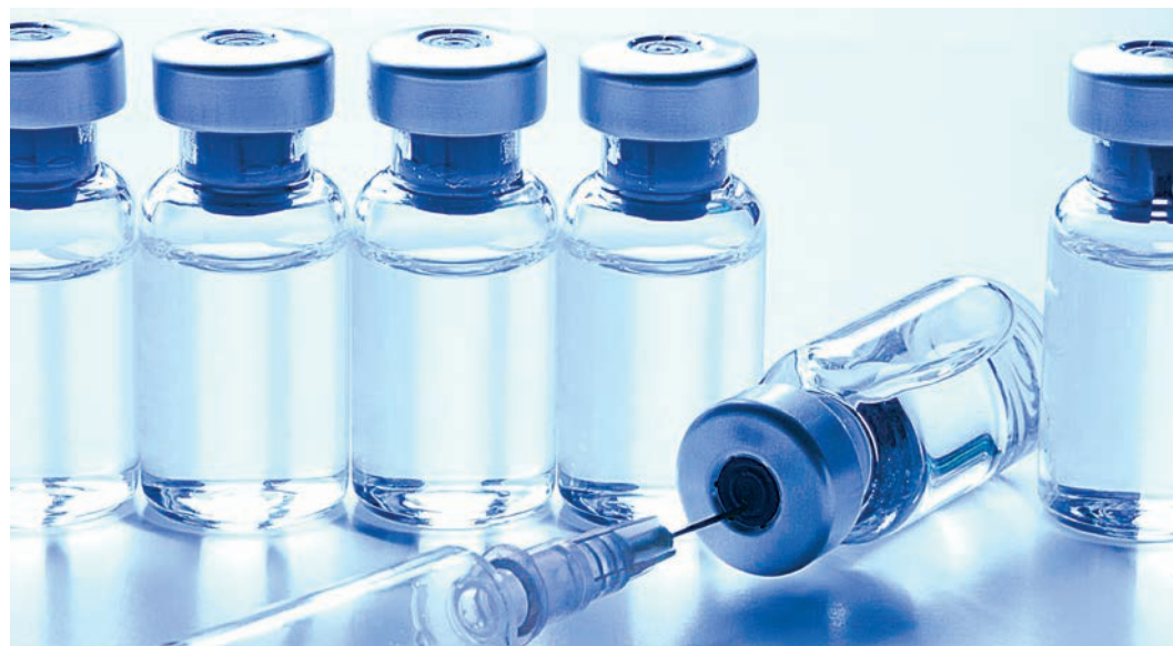
Удельный вес привитых от гриппа в общем количестве заболевших не превышает 8 процентов.