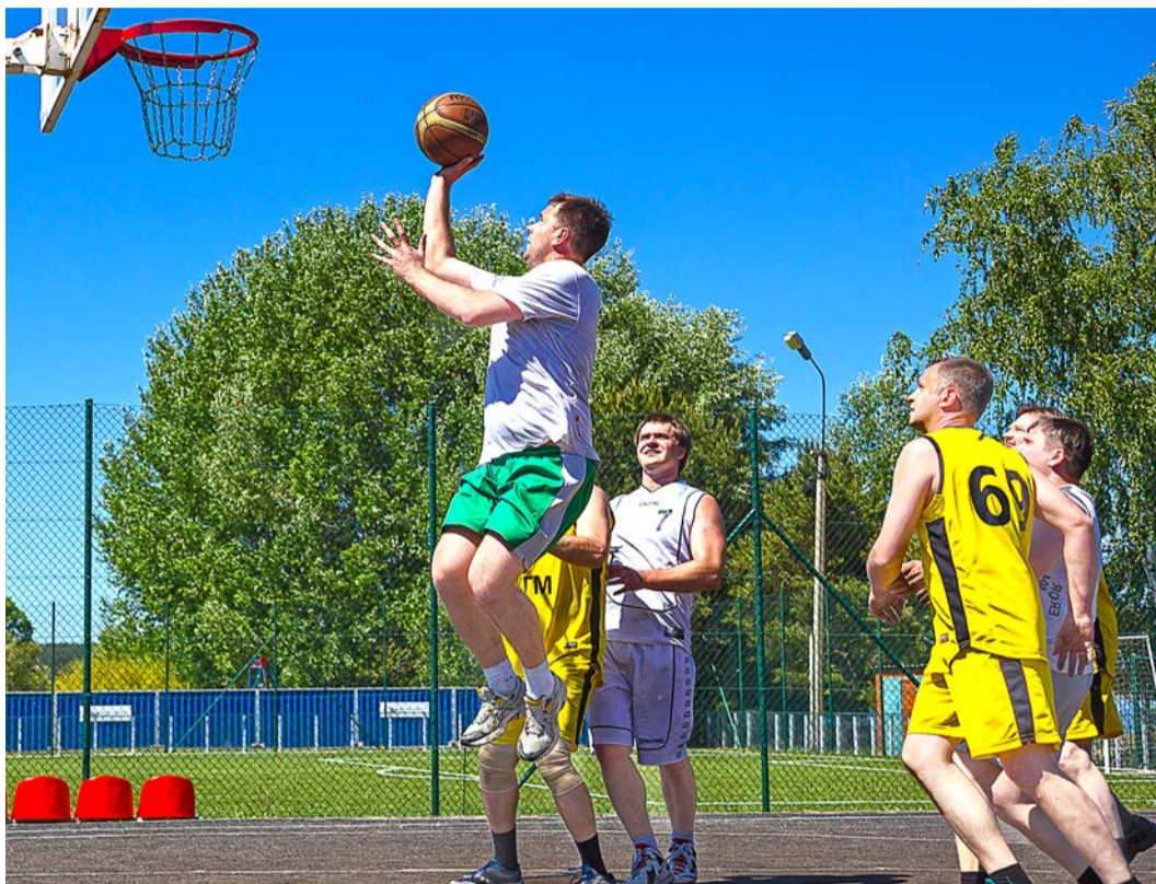
Соревнования по стритболу.

Некоторые лидеры предварительных этапов не смогли выйти в финал, а вот «новички» порой внезапно вырывались вперёд. «Рукоборцы» комбината стремились реализовать преимущество в трёх встречах — по числу групп. В первой лидерами по результатам поединков стали атлеты ЭСПЦ, второе место заняли спортсмены СПЦ №2, третье — работники СПЦ №1. Во второй группе первое место в списке занимает АТЦ, второе — ЭЭРЦ, третье — РМЦ. В третьей группе места распределились следующим образом: «золото» досталось ЦМК, «серебро» — ТСЦ, «бронза» — ЭнЦ №1. Соревнования по пляжному волейболу, прошедшие на базе отдыха «Металлург», были более длительными. Спортсменам предстояло сыграть три тура из трёх партий до 25 очков, а дошедшим до третьей партии — до 15 очков с разрывом от соперников в два очка. Первое место в своей группе снова заняли работники ЭСПЦ, за ними в списке следуют волейболисты ЦРМО и замыкает тройку команда СПЦ №1. Во второй группе первой была признана команда ОСМиБТ, второй — ЦОП, третьей — ЦОиМ. Самой напряжённой выдалась борьба в третьей группе, где за призы билась целых девять команд. В ней первое место досталось ЭнЦ №1, второе — УАМ, третье — ЦТТ.