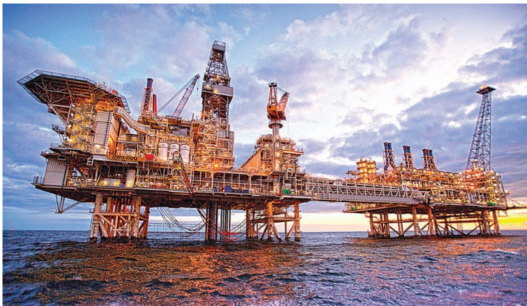
Наибольший рост показали китайские бренды, число которых с одного в 2006 году увеличилось до 14 в этом.