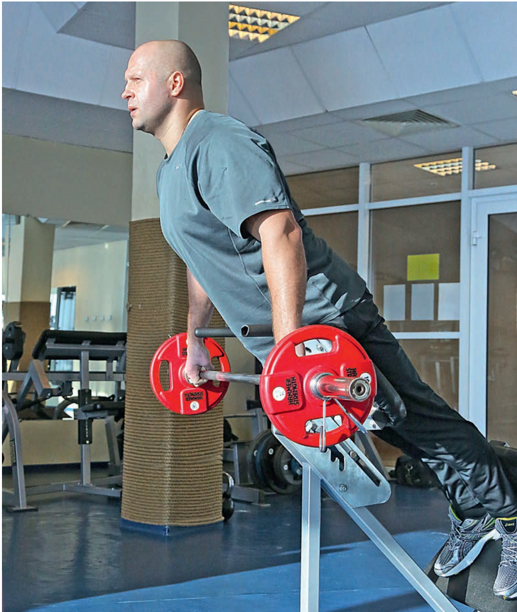
Тренировки в родных стенах Дворца спорта имени Александра Невского.

— Это очень хороший человек. Он — типичный семейный