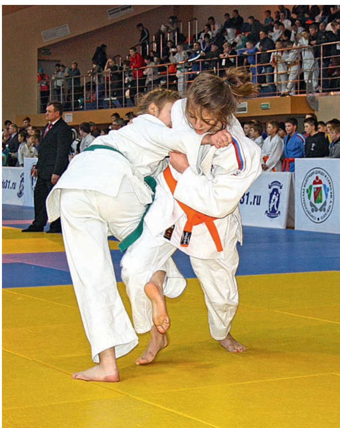
В дзюдо сегодня — девушки!

России. — Для детей такие турниры крайне значимы. Это — подготовка к взрослым стартам, отбору в национальные сборные. Сражаясь с соперниками, представляющими различные школы дзюдо, подрастают уникальные чемпионы. И благодаря этому делают первые шаги к чемпионским титулам. Сейчас турнир проводится под опекой Металлоинвеста и международного фонда «Поколение». А организаторами выступили СШОР имени святого Александра Невского, местная и областная федерации самбо и дзюдо. Информационную поддержку турниру оказали ОЭМК-ТВ, газета «Электросталь» и интернет-портал Oskol.city, где можно было наблюдать за схватками в режиме реального времени.