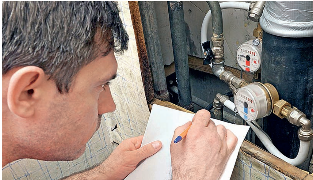
Больше всего цена вырастет в графе «водоснабжение» — до 8,2 процента.

В числе ещё одних важных изменений в сфере ЖКХ — порядок оплаты общедомовых нужд (ОДН). Сюда входит плата за коммунальные услуги (за холодную и горячую воду, электро- и теплоэнергию, газоснабжение и водоотведение), которые идут на содержание мест общего пользования в доме (освещение в подъезде и так далее). С 1 января текущего года премьер-министр РФ Дмитрий Медведев утвердил правила общественного контроля за деятельностью предприятий в сфере ЖКХ. Таким образом, если раньше в квитанции была отдельная строка оплаты за ОДН, то теперь она будет включена в содержание жилья. Сумма за общедомовые нужды