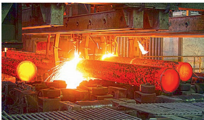
Литая заготовка для ОМК будет производиться на Уральской Стали.