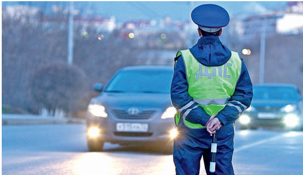
Белгородские полицейские имеют одни из самых высоких показателей в стране в части доверия населения.

Также, по словам представителя силового ведомства, на региональном уровне следует обратить внимание на появление новых видов преступлений. В частности — на мошенничество в различных формах, особенно компьютерное. — Нужен особый контроль и за относительно новыми видами