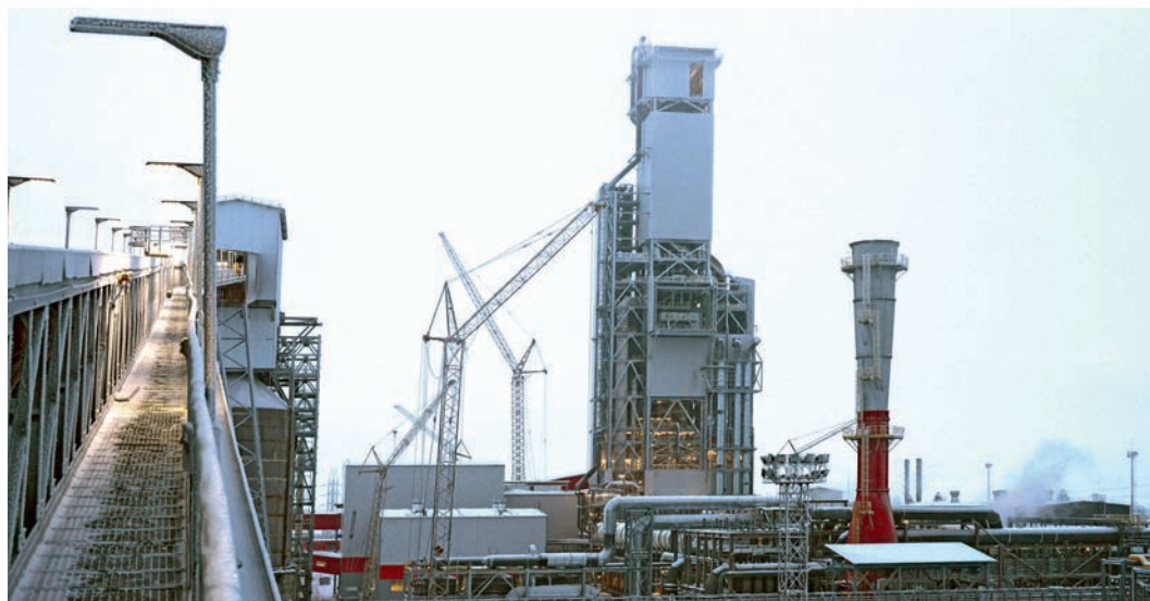
Главный инвестиционный проект компании «Металлоинвест» уже обрёл чёткие и ясные очертания.