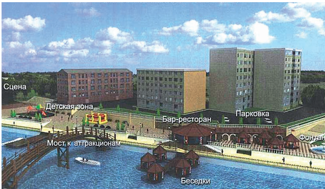
Протяжённость набережной в квартале Старая мельница — 180 метров, общая площадь — 4000 кв. метров.