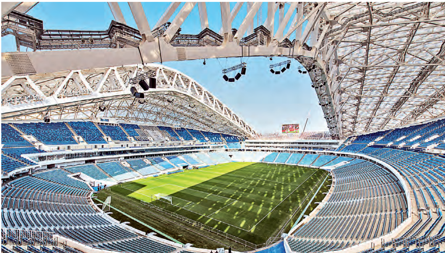
Стальная продукция Металлоинвеста использовалась для строительства стадиона «Санкт-Петербург» в культурной столице России.

Металлоинвест внёс свою лепту в ЧМ-2018: для строительства спортивных объектов, где проходят матчи главного футбольного состязания планеты, компания поставила более 25 тысяч тонн металлопроката.