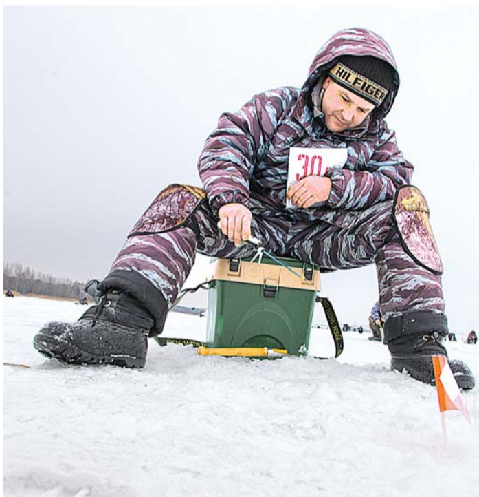
Главное — процесс.