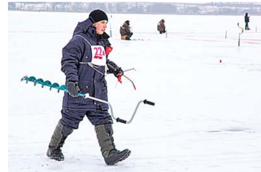
Здесь рыбы нет...