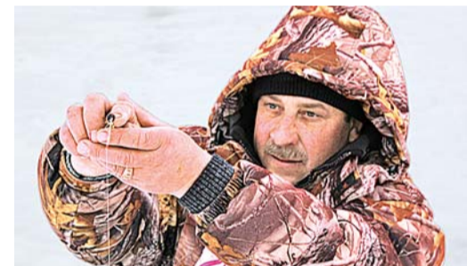
Вдохнуть и не дышать...