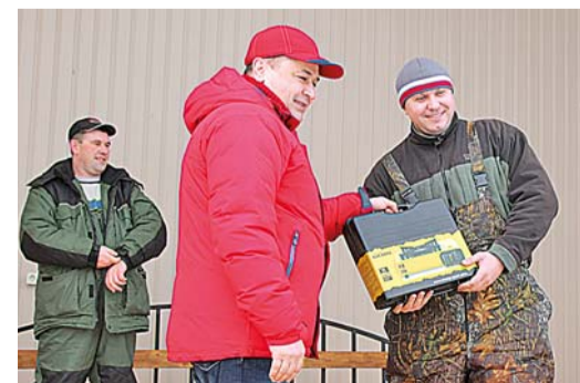
Призы от профкома — самым удачливым.