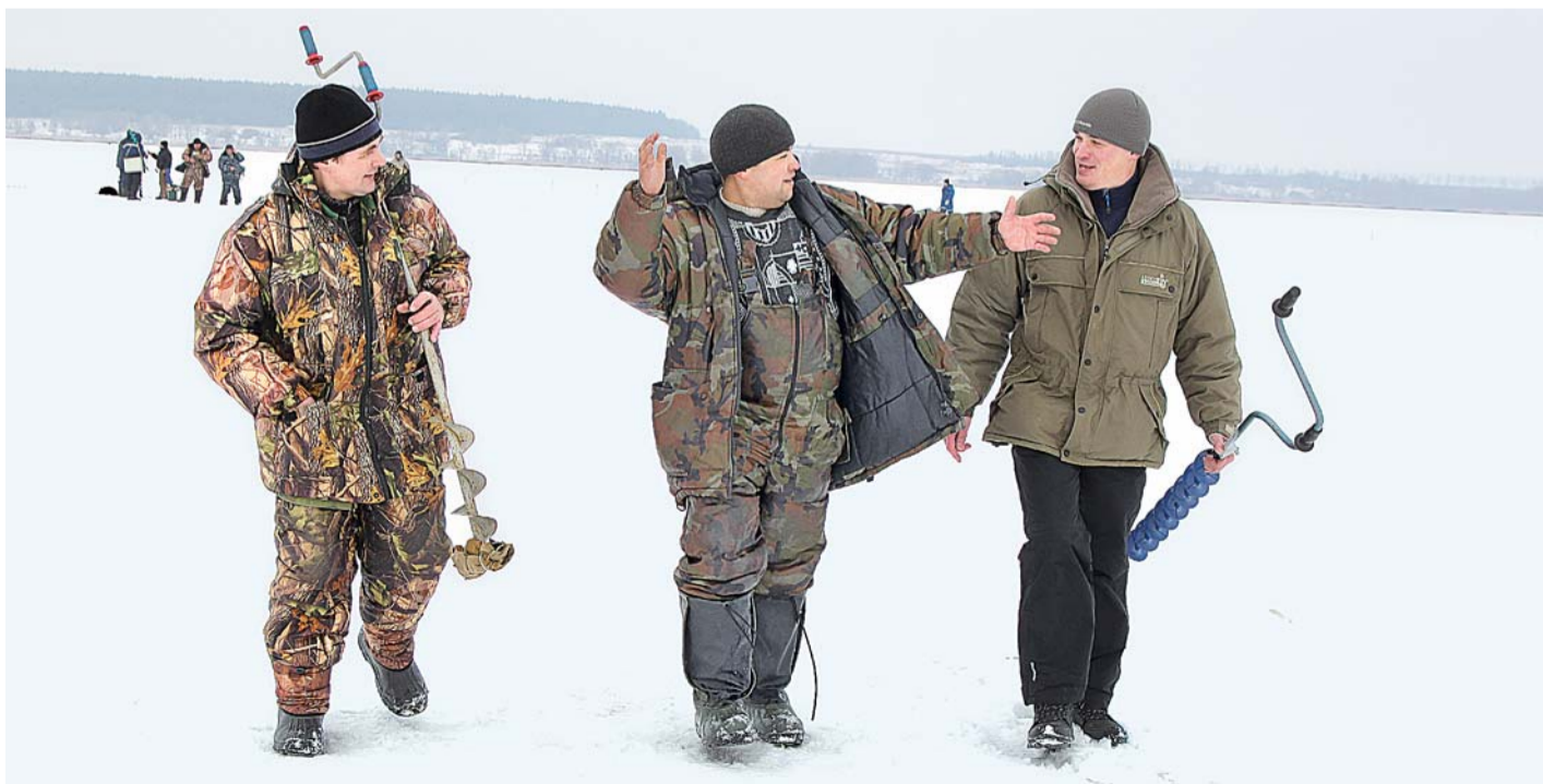
Вот такая... Но сорвалась!