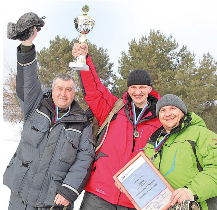
«Три богатыря» зимней рыбалки из второго сортопрокатного.