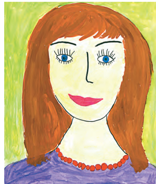
Автор: Виктория Редругина, 5 лет.