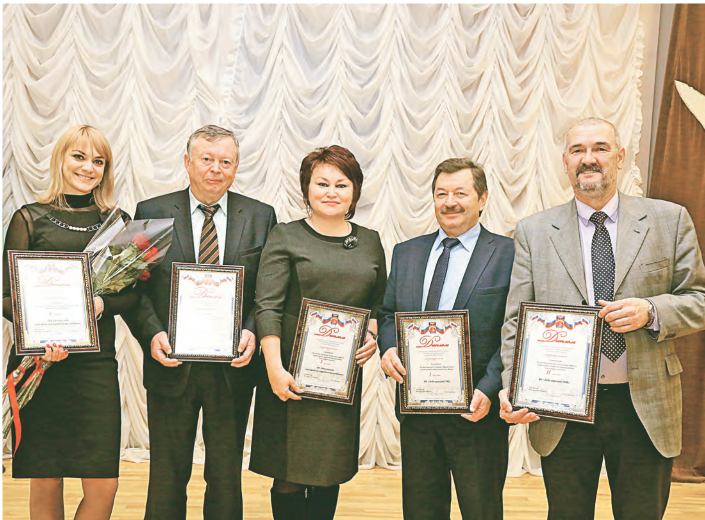
Результаты конкурса в очередной раз подтвердили, что на ОЭМК и Лебединском ГОКе проводится большая социальная работа.

Предприятия Металлоинвеста стали победителями и призёрами регионального этапа Всероссийского конкурса «Российская организация высокой социальной эффективности».