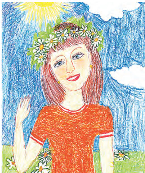
Автор: Андрей Шляхтин, 9 лет.