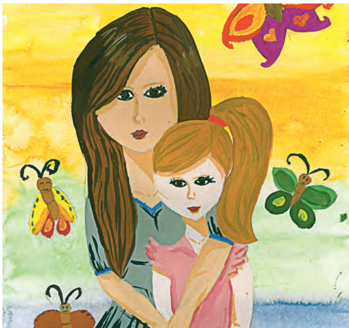
Автор: Екатерина Ерофеева, 11 лет.