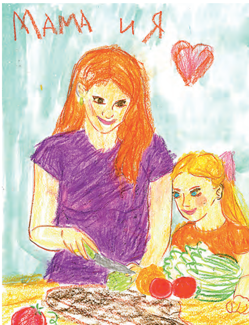
Автор: Игорь Стёпкин, 12 лет.