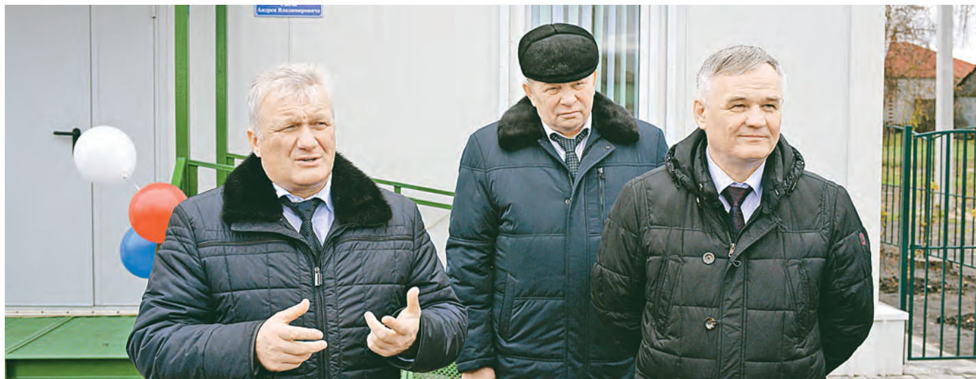
Новый фельдшерско-акушерский пункт — островок здоровья для жителей трёх сёл: самих Озёрки, Выползово и Хорошилово — более 1600 человек.