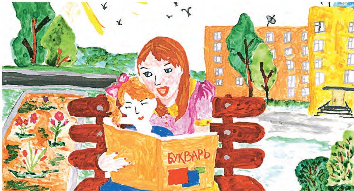
Автор: Рената Головань, 7 лет.