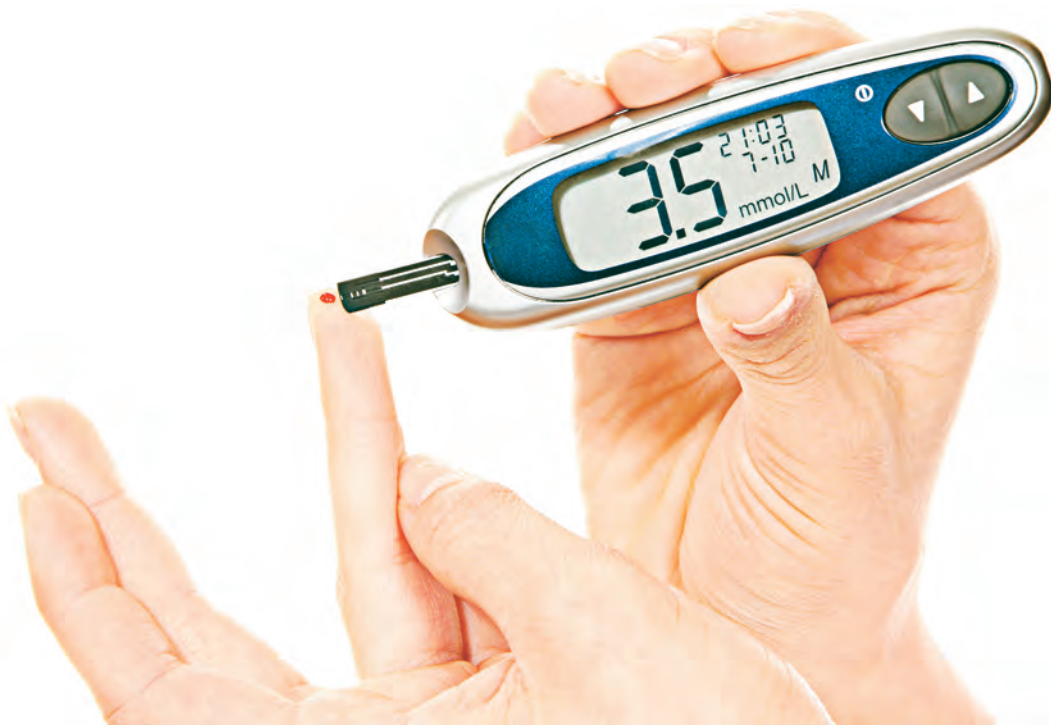
Регулярно проверяйте уровень глюкозы в крови!

26 НОЯБРЯ – ДЕНЬ БОЛЬНОГО САХАРНЫМ ДИАБЕТОМ