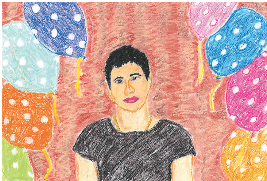
Автор: Тимофей Дергилёв, 8 лет.