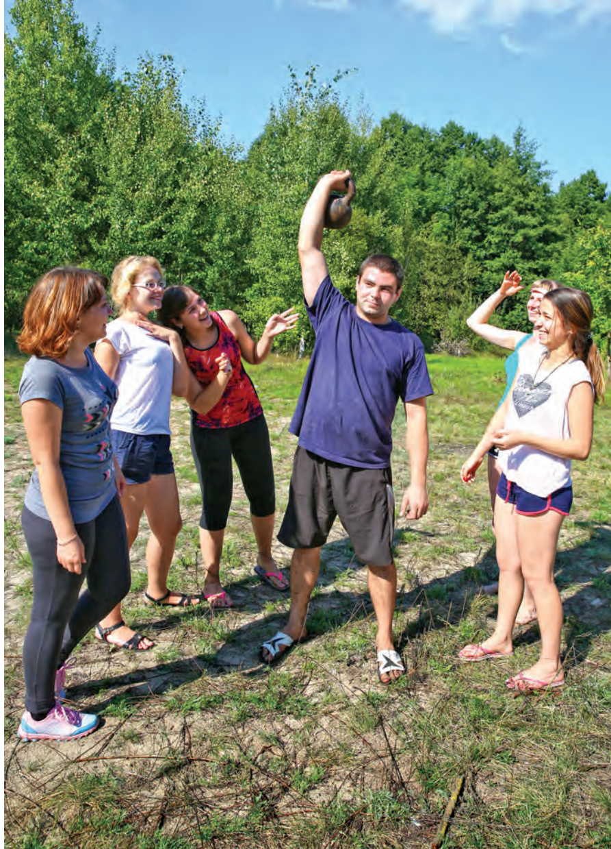
А ведь гирию надо было ещё донести!