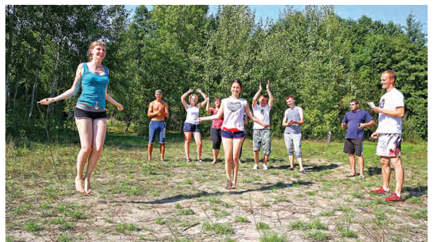
Ничто так не улучшает аппетит, как игры на свежем воздухе!