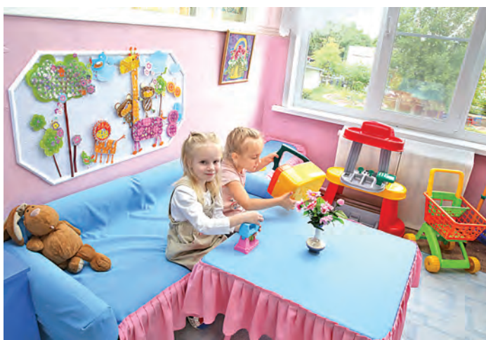
— Наш проект поддержали логопеды и психологи детских садов №52 и №10. Шесть учителей-