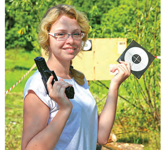
В группу «Спорт для всех» можно вступить, просто зайдя по ссылке в социальной сети «ВКонтакте».