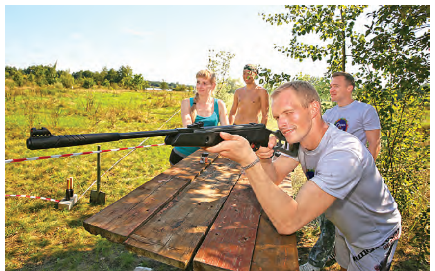
Только в яблочко!