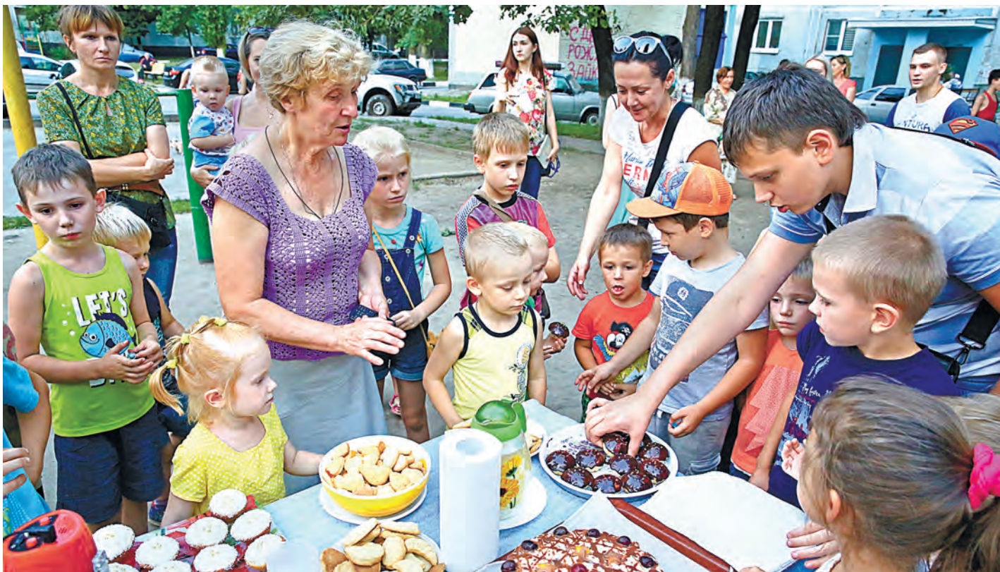
Проект «Дружный дворик» – один из 16 победителей городского конкурса «Сделаем вместе!» компании «Металлоинвест».