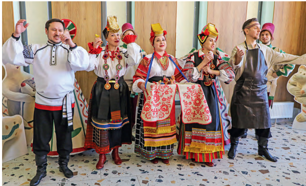
▲ Социальный форум — площадка для общения, обмена опытом и демонстрации наработок, направленных на развитие городов

К юбилею организаторы подготовили ряд нововведений. Впервые, увеличили грантовый фонд до 12 млн рублей — то есть для каждого из трёх городов выделили по дополнительному