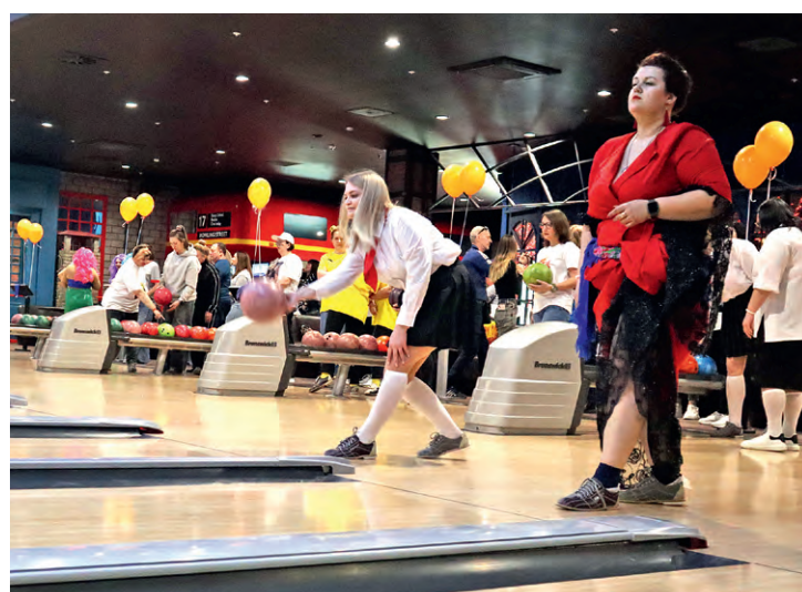
▲ Всегда на спорте!