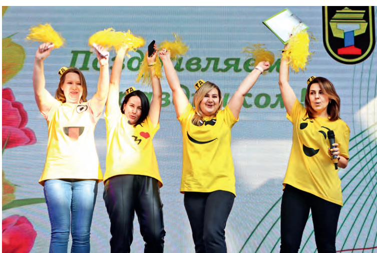
▲ Команда «Смайлики» (техдирекция), 2 место в соревнованиях по боулингу