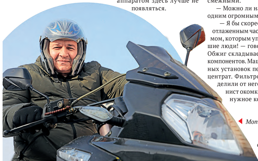
◀ Мотоциклы — одно из неизменных увлечений агломератчика

— Я бы скорее сравнил его с отлаженным часовым механизмом, которым управляют хорошие люди! — говорит Зубков. — Обжиг складывается из многих компонентов. Машинисты насосных установок перекачали концентрат. Фильтровальщики отделили от него влагу. Машинист окомкователя сделал нужное количество ока-