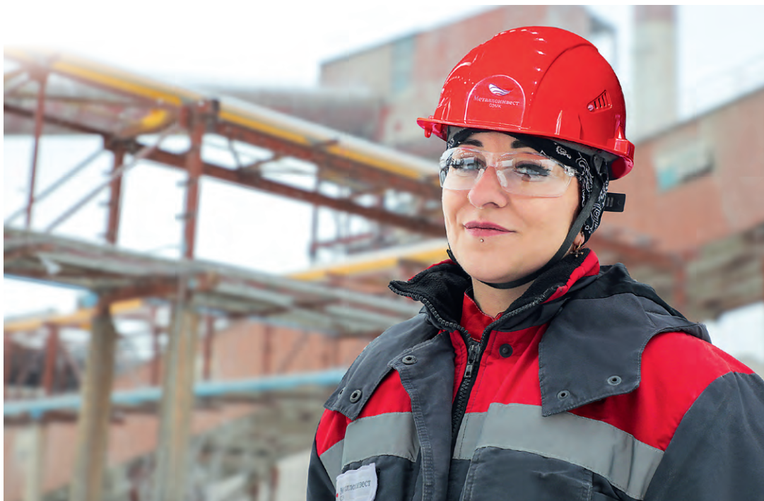
▲ «Люблю свою работу и коллектив»

— Конечно, профессия шихтовщика-дозировщика не из лёгких. Почти всю смену на ногах. Нужно следить за оборудованием, за правильной подачей извести. Я к физическим нагрузкам привыкла, рабо-