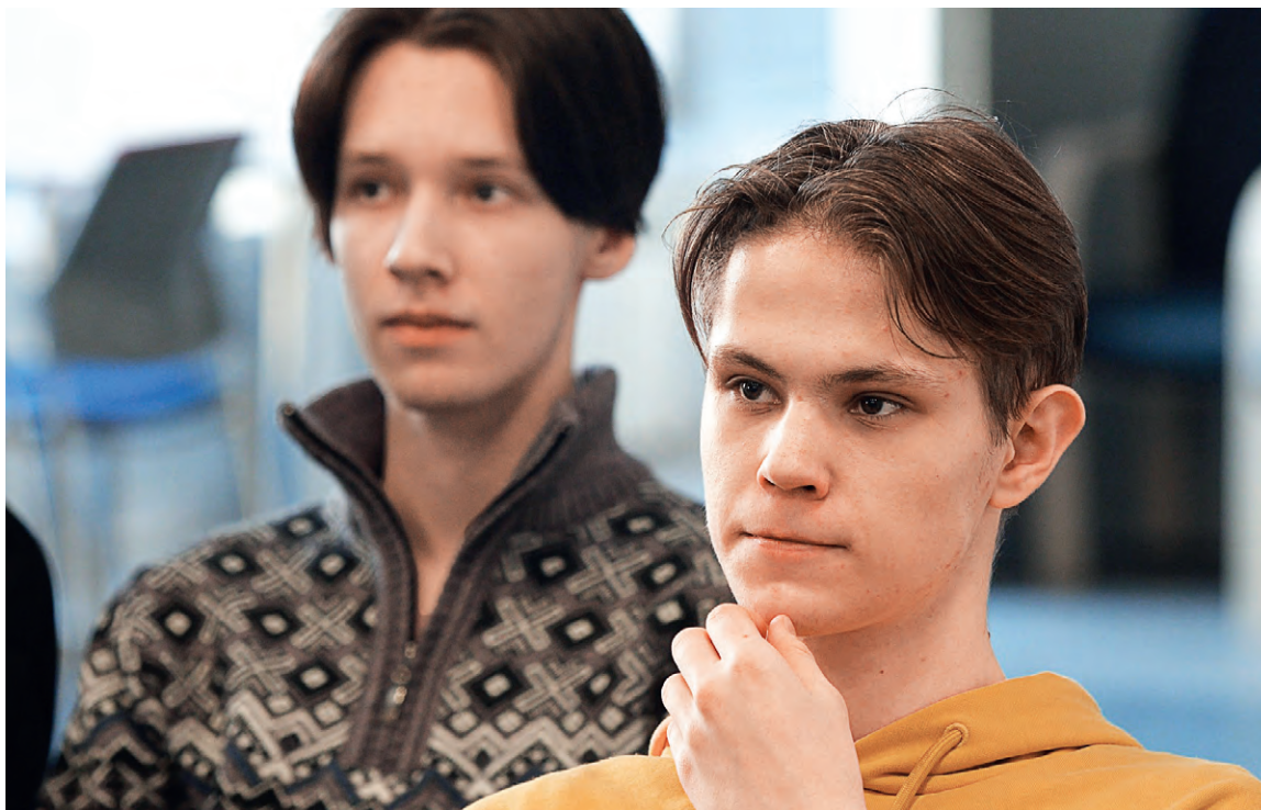
▲ Студентам МИСИС рассказали о перспективах работы на комбинате

«Если ребята любят горное дело и металлургию, то наш комбинат — лучшее место работы для них».