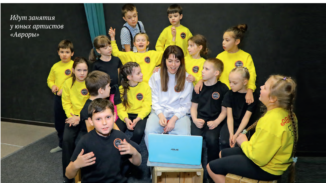
Идут занятия у юных артистов «Авроры»

Детско-юношеские любительские театральные коллективы со всей страны показали свои спектакли. Приз зрительских симпатий получила постановка «Денискины рассказы» маленьких воспитанников