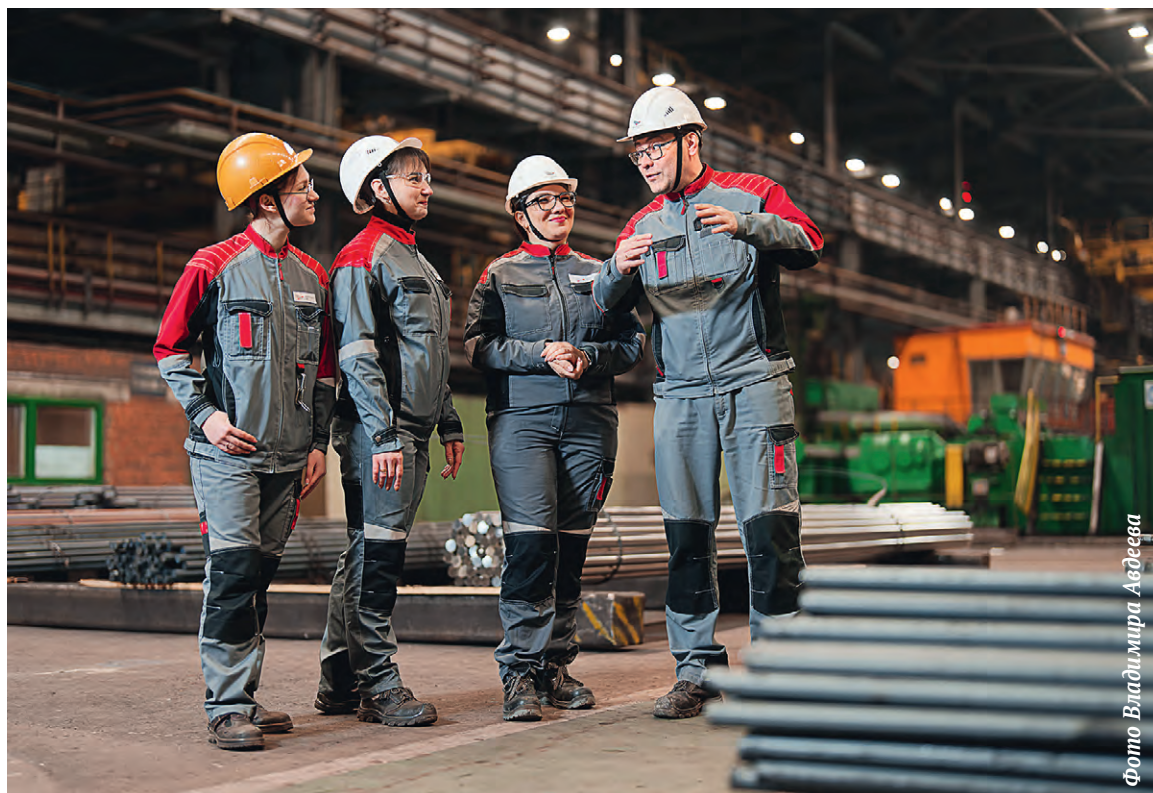
▲ Пересмотр дохода с учётом оценки ABCD по большинству рабочих профессий и РСиС в цехах пройдёт в апреле 2025 года

— Как это ни странно — никакой из вышеперечисленных.