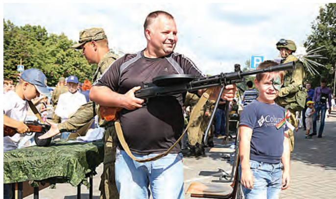
Оружие времён Великой Отечественной войны пользуется особой популярностью. Приятно чувствовать себя наследником Великой Победы!