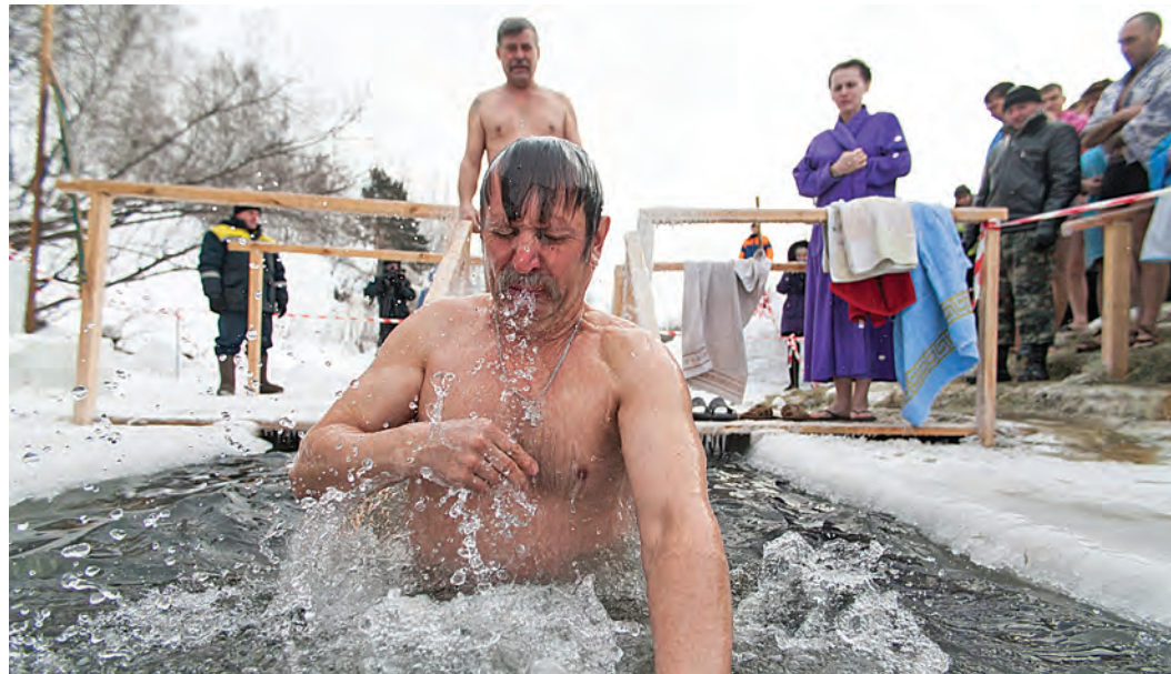
На Крещение в купели на реке Оскол становится тесно.

Свой вагончик на берегу реки Оскол у моржей появился в январе 1987 года. Здесь любители зимнего плавания могли в тепле переодеться, обсохнуть и выпить горячего чая. В те годы клуб насчитывал сотню активистов. Конечно, было тесновато, но даже этот минимум комфорта всех устраивал. После распада СССР клуб любителей зимнего плавания перестал получать поддержку от городских властей. В вагон-