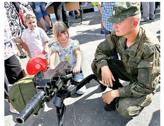
«Пламя» кукол не заменит!