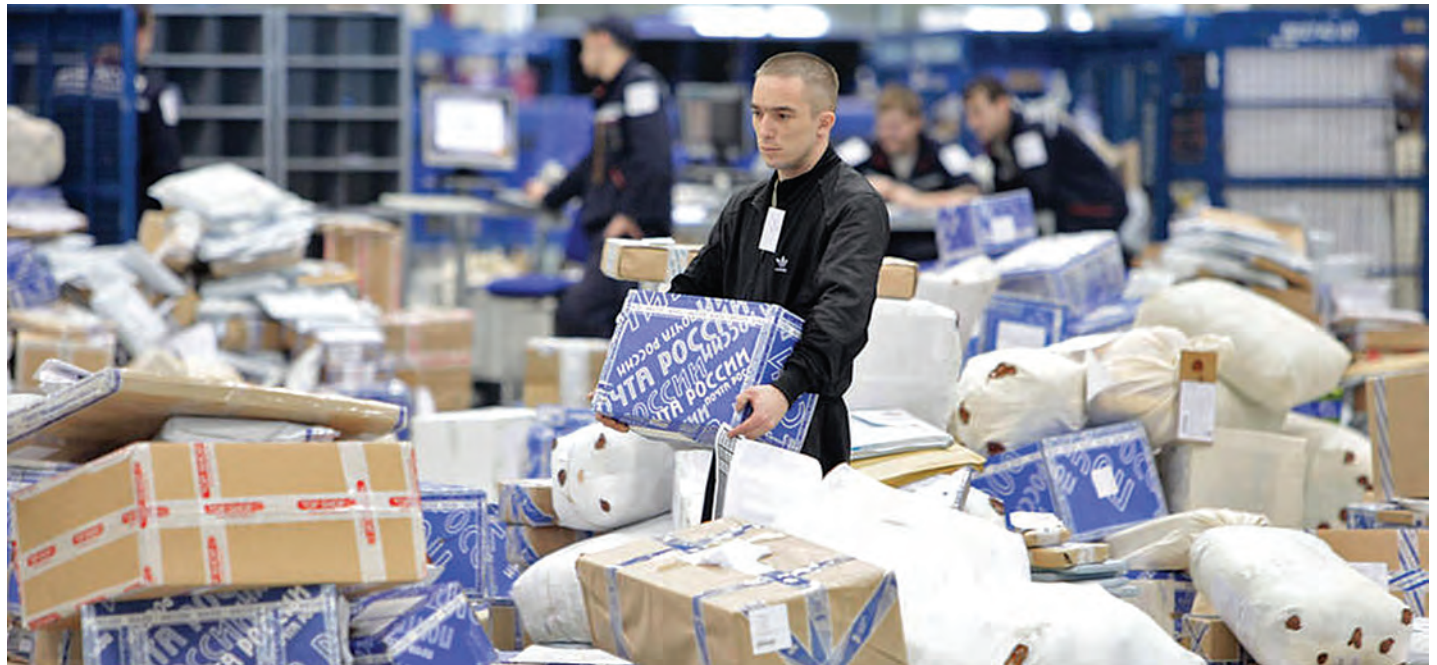
Отправители посылок за границу самостоятельно занимались их таможенным декларированием. Теперь это будет возложено на «Почту России».