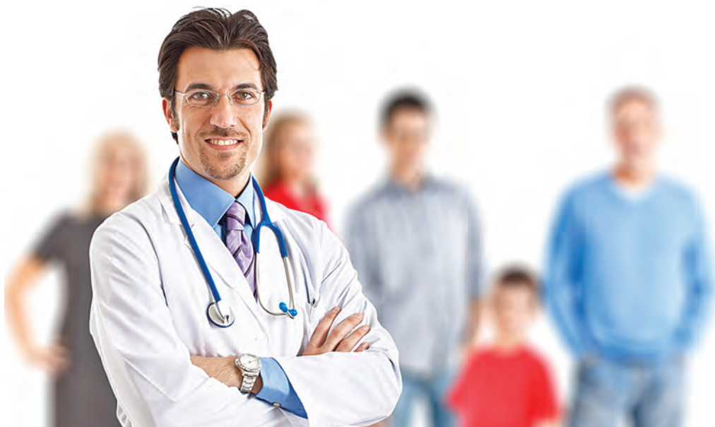
Врачи-терапевты после дополнительной подготовки переквалифицируются во врачей общей практики.

За работой Центра управления здоровьем будет следить Наблюдательный совет, состоящий из представителей администрации округа, департамента здравоохранения и социальной защиты населения области, а также главных врачей медицинских организаций и общественности. Административный корпус Центра будет состоять из руководителя, заместителя, бухгалтера, экономиста, программиста,