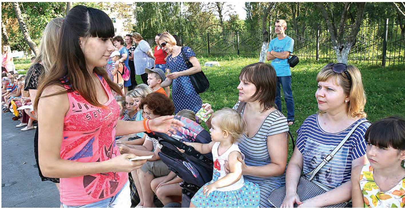
На календариках, которые дарили активисты, изображены силуэт сердечка и две соединённые ладошки на фоне солнечных лучей.