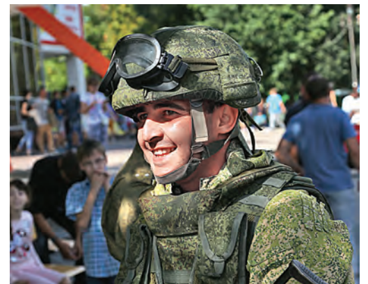
Улыбка - главное оружие всех «вежливых людей»!