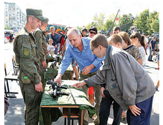
Те кто служил, те не забудут и будут эту правду знать. И будут номер автомата по телефону набирать...

Ребяты, словно десант, облепила камуфляжные борты БТР-80. Их отцы неподалёку деловито обсуждают тактико-технические характеристики гаубицы «Мста», чей длинный ствол устремился в небо. – Я вот на такой же служил. Помню, как-то раз на учениях..., – рассказывает соседу круглолицый крепш. – И, слава богу, что только на учениях..., – с серьёзным лицом комментирует эти воспоминания его товарищ. Симпатичная девчушка лет десяти крепко сжимает рукоятки 30-миллиметрового автоматического гранатомёта АГС-17 «Пламя». Весело смеётся, говорит, что похоже на руль от велосипеда! На столах разложено всевозможное стрелковое и прочее оружие: единый пулемёт «Печенег», снайперская винтовка Драгунова, ручная пулемёт Дегтярёва времён Великой Отечественной войны и не менее ручной противотанковый гранатомёт РПГ-7 уже наших дней. Желаящих потрогать воронёную сталь хоть отбавляй!