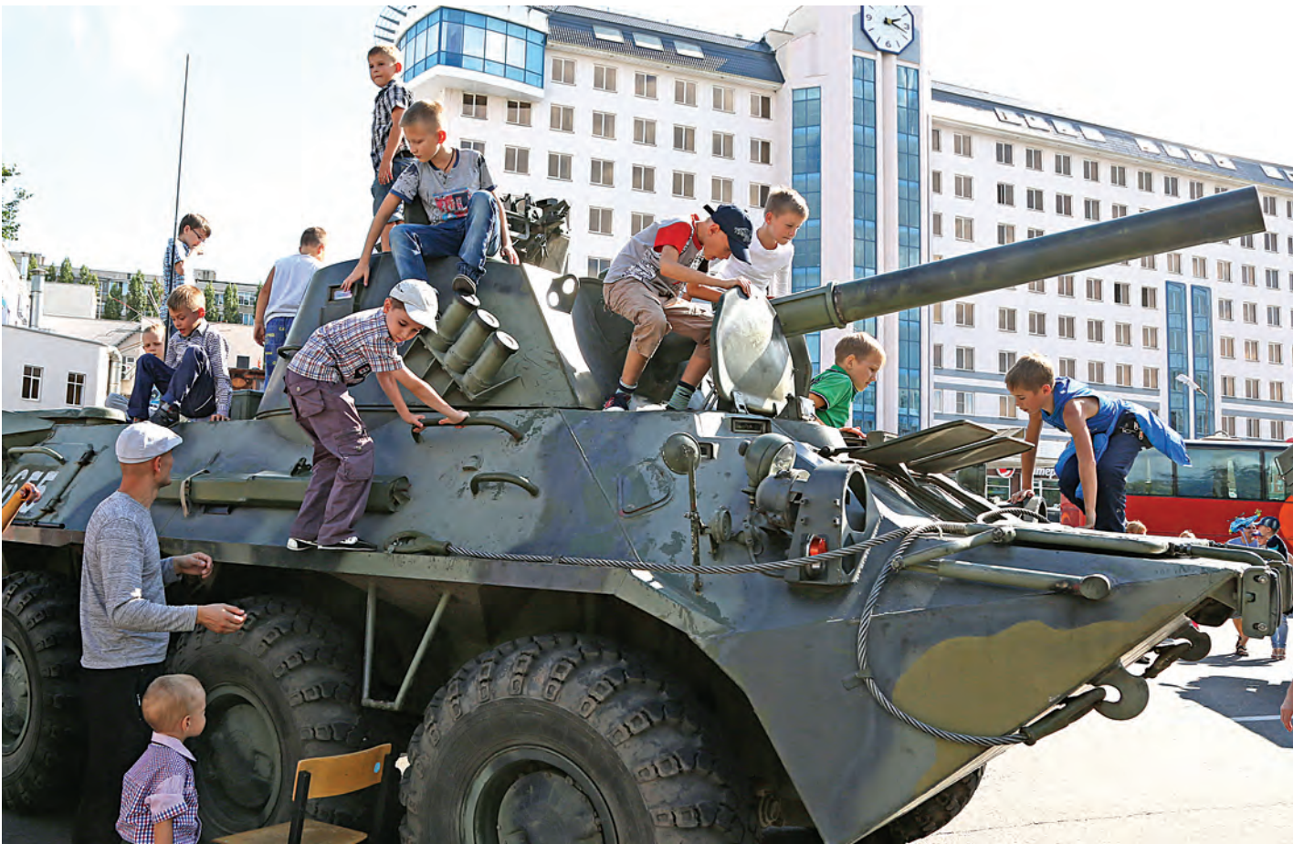
Самоходка «Нона» - это вам не папин «Мерседес»!

Это означает, что в Старом Осколе – городе воинской славы – отмечают большой, любимый и очень мирный праздник. А боевая техника на площади Победы в День города, очевидно, теперь станет для него доброй традицией.