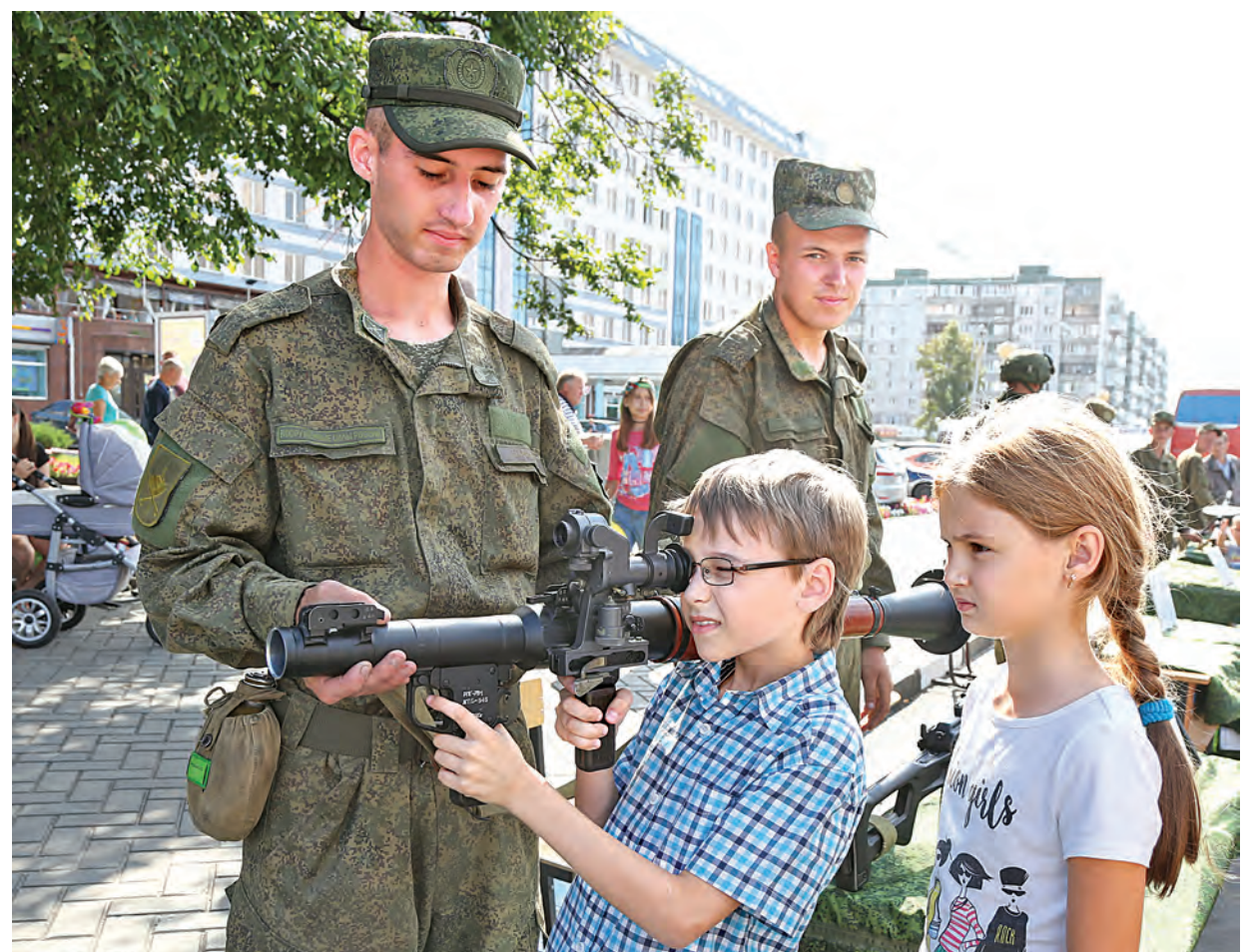
Боевое крещение РПГ-7 состоялось в 1968 году во Вьетнаме. Прост и надёжен. Специалисты говорят, что управятся даже дети. Впрочем, для них пусть это будет лишь в компьютерных играх!

Александр Ивановский