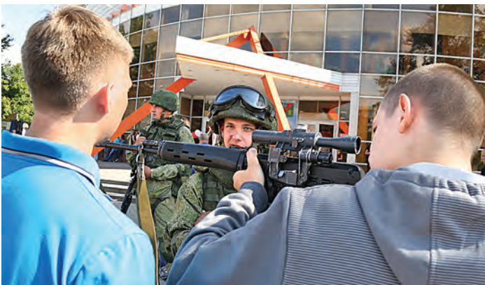
Приклад снайперской винтовки Драгунова удобно ложится к плечу. Скоро осенний призыв...