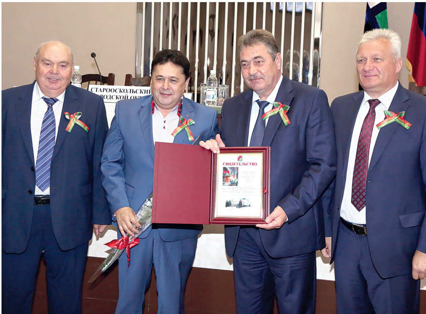
В этом году трудовой коллектив ОЭМК вновь занесён на Доску почёта Старооскольского городского округа.

Начало осени в Старом Осколе ознаменовалось сразу двумя праздниками. Ещё не умолкла трель первого школьного звонка, как 3 сентября улицы украсили разноцветные шары и флаги.