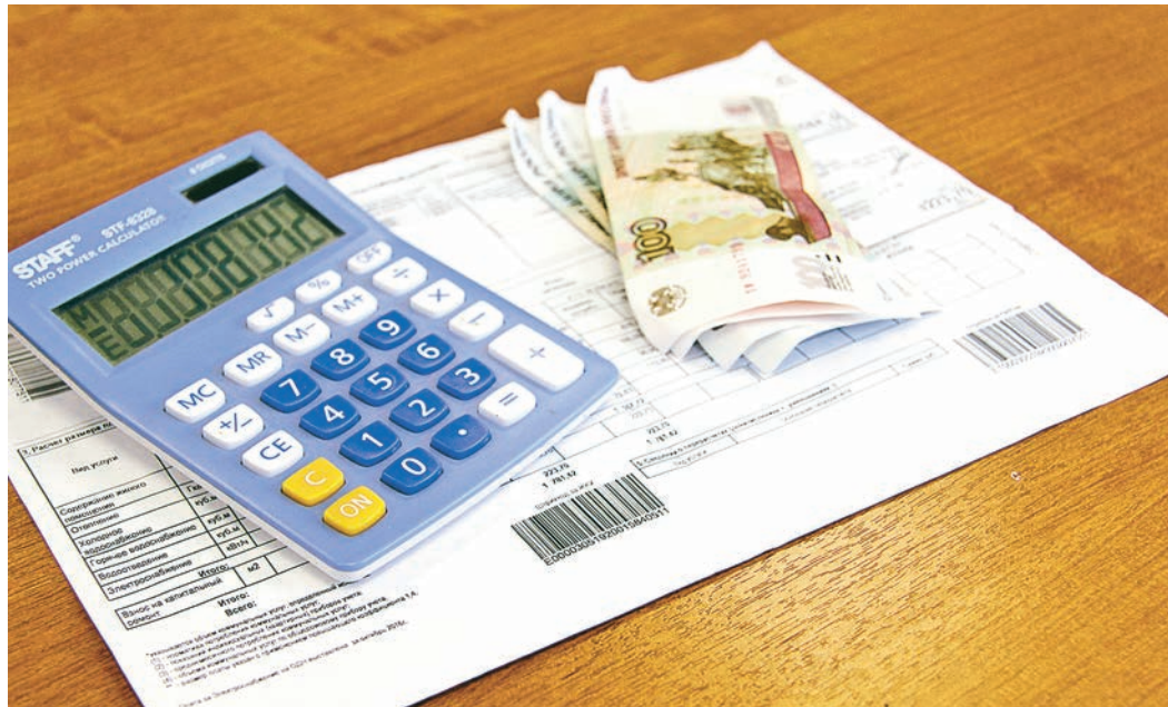
На 1 декабря 2016 года долги старооскольцев перед управляющими организациями, «Водоканалом» и «Теплоэнерго» составили около 400 миллионов рублей. Для любителей точных цифр — 423881745,86 рубля.