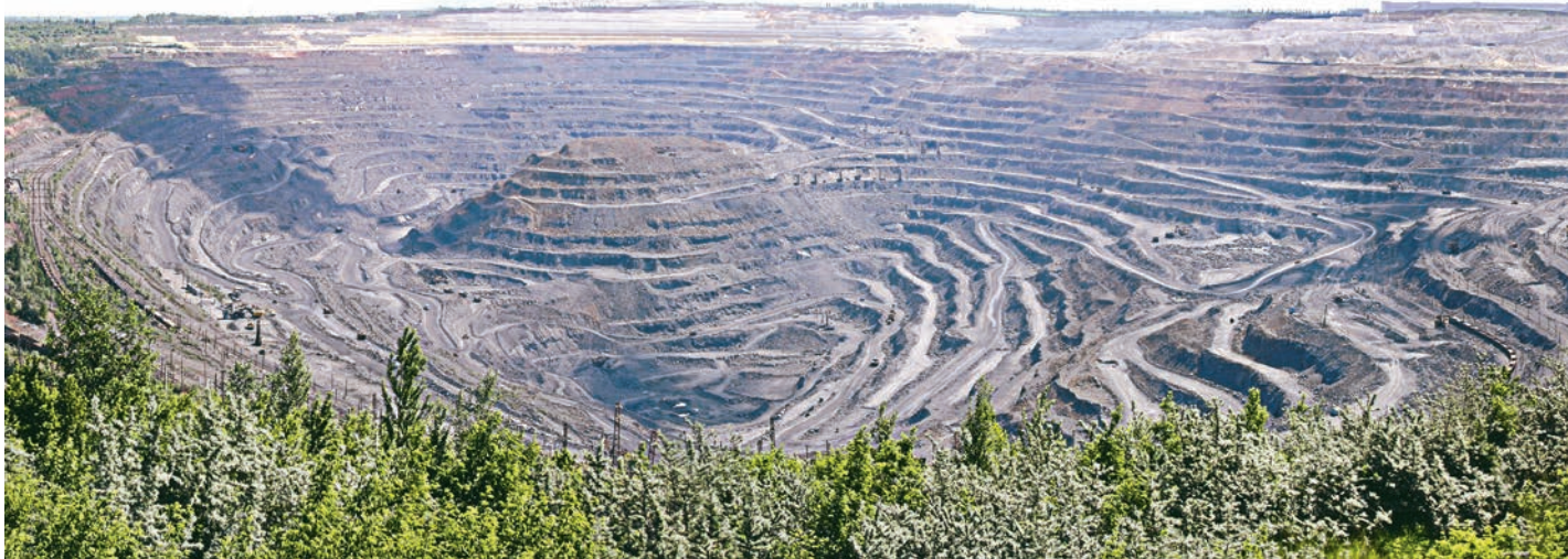
СТИ НИТУ «МИСиС». Лицензия №1947 от 19.02.16 г. Серия 90Л01 №0008980. Выдана Федеральной службой по надзору в сфере образования и науки.