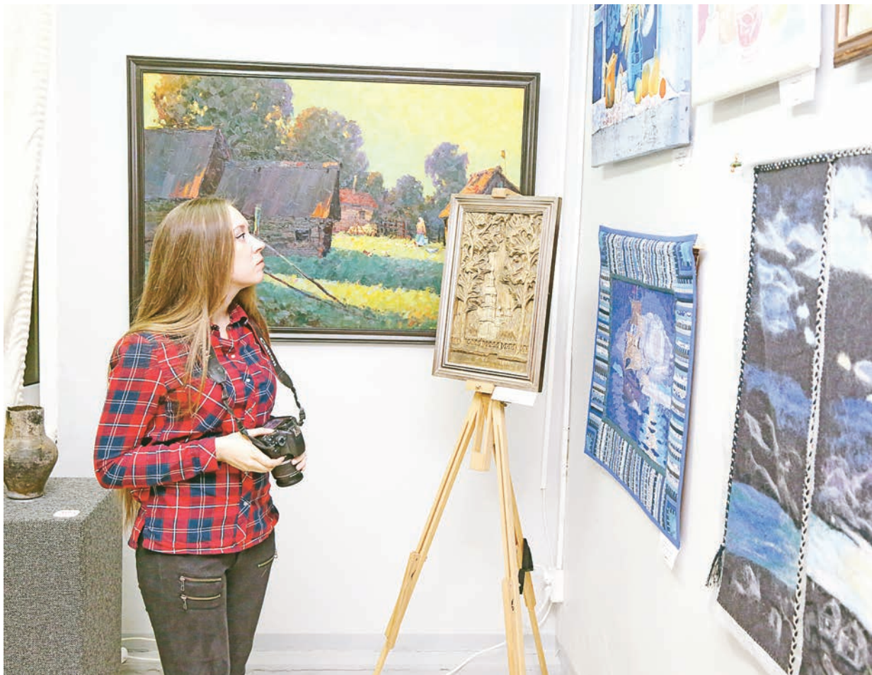
Старооскольский художественный музей приглашает на экскурсии любителей живописи!