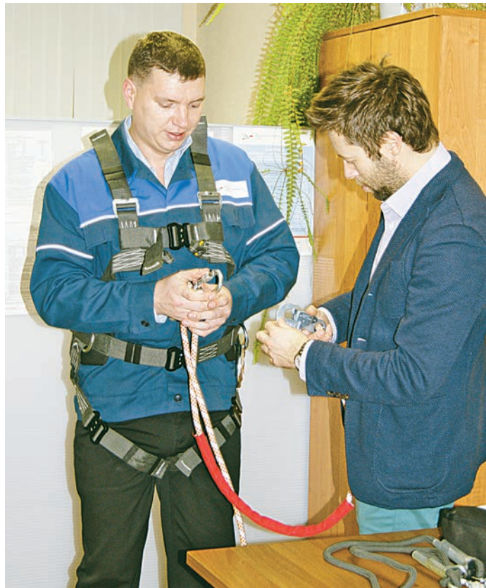
Высота — опасный производственный фактор при многих видах работ.

Инициативу по организации необходимого обучения взяла на себя комиссия комбината по контролю качества средств индивидуальной защиты, тем самым значительно расширив круг своих помощников. Во время таких занятий в управлении охраны труда и промышленной безопасности основные знания по обсуж-