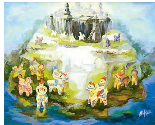
Маркова Е. М. «Всадники старой крепости», 2016 год.