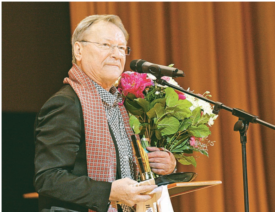
Сергей Шакуров пообещал, что попробует приехать в наш город с новым спектаклем «О вредных привычках».

сериале «Брежнев» всё сложилось блестяще! — На роль Леонида Ильича пробовались двадцать артистов. Вячеслав Шалевич, Богдан Ступка, Родион Нахапетов, даже Юрий Стоянов из «Городка». Поскольку картина была проектом Первого канала, утверждением занимался лично Константин Эрнст, — рассказывает Шакуров. — И вот сидим мы с ним, судим КВН и вдруг Эрнст наклоняется ко мне и говорит: «Ты утверждён!». Серьёзному портретного грима не понадобилось. Разве что брови и немного седины на волосы. Больше ничего с лицом не делали. Это сейчас Безрукову сделали маску — точную копию Высоцкого. А во время съёмки «Брежнева» ничего подобного не было. Так что правдивость образа достигалась за счёт актёрского мастерства. И, тем не менее, Сергею Шакурову удалось очень органично и точно войти в роль. Обладая удивительной способностью перевоплощения, он создал образ старого, измученного болезнью и интригами человека. — Сергей Каюмович, а у вас есть любимая роль? — спросили из зала. — Ответом словами Натальи Гундаревой. Когда-то ей задали такой же вопрос, и она ответила: «Как нельзя из пяти детей выбрать любимого, так и с ролями... они тоже все любимые». Вот и у меня — все любимые. — А как вы память тренируете? — прозвучал вопрос. — Учю стихи. Хорошие. Это самая лучшая тренировка. И вам советую делать так же. Для себя. Для жизни. — О семейном положении расскажите! — А что тут рассказывать? Жена — умница-красавица,