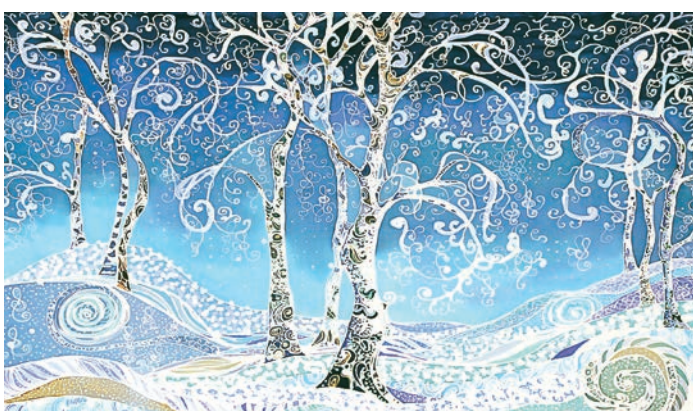
Тихонова Т. Г. «Весенняя рапсодия», шёлк, горячий батик, 2016 год.