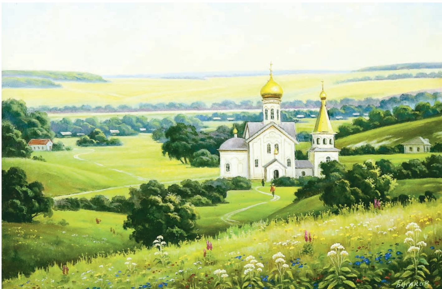
Бугаков Г. Ф. «Свято-Троицкий храм. Холки», холст, масло, 2016 год.