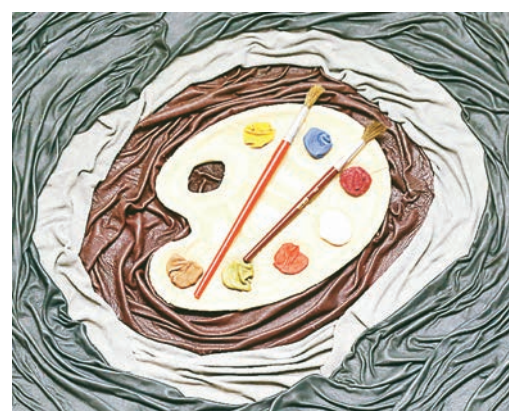
Болотова О. В. «Палитра», кожа, 2016 год.