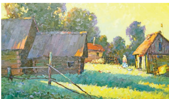
Филиппов А. Г. «Жаркий вечер», холст, масло, 2016 год.