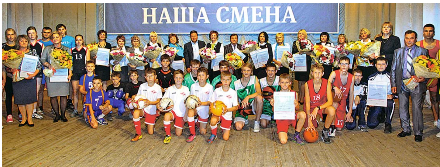
Начало на стр. 1