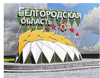
жат сделать самому автору, позже его воплотят в жизнь. БелПресса

разнообразных формах — от простой стелы-столба до сложных куполообразных беседок с организованным вокруг пространством для прогулки. Жюри выберет 10-12 наиболее перспективных работ, из которых в итоге оставит три лучшие. Имена финалистов конкурса назовут 30 октября. Премия за первое место составит 270 тысяч рублей, за второе — 150 тысяч, за третье — 77 тысяч. Лучший эскиз доработают профессионалы или предло-