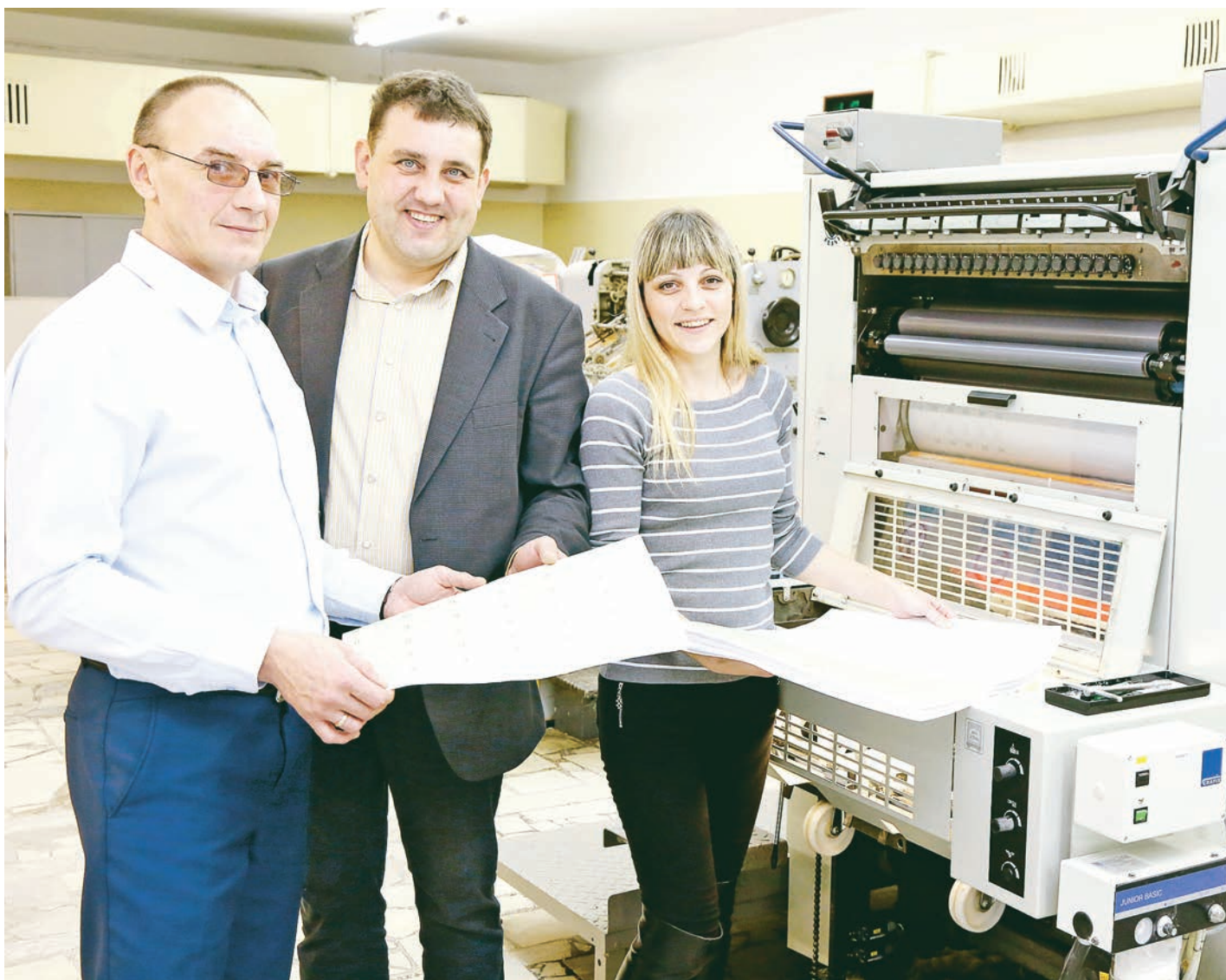
Сегодня современные технологии облегчают труд полиграфистов. Но процесс печатания по-прежнему остаётся трудоёмким.

Сегодня, 13 января, свой профессиональный праздник — День российской печати — отмечают сотрудники средств массовой информации, типографий и издательств.