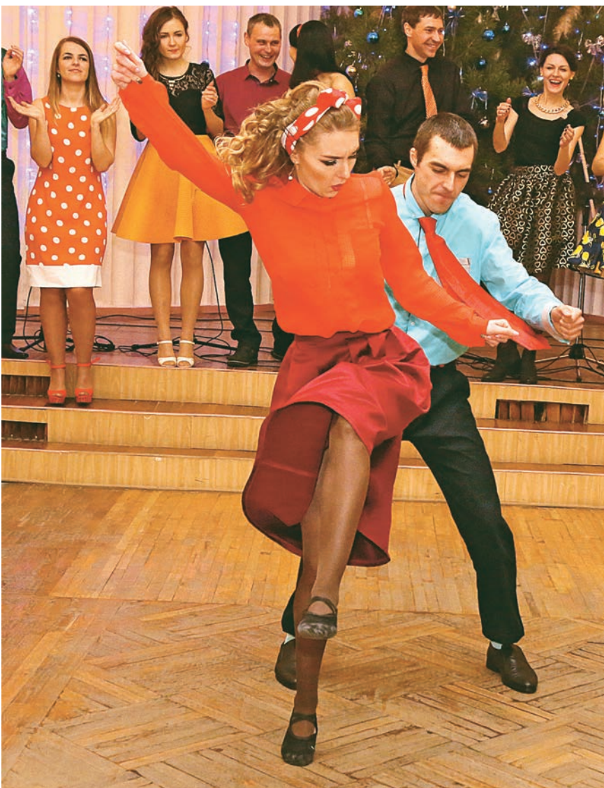
Новую пластинку нам ставит ди-джей, я приглашаю тебя потанцевать, хэй-хей!

Д ерзкие, смелые, энергичные. На производстве — сталевары, вальцовщики, сварщики, операторы, инженеры, а на бале молодёжи ОЭМК — стилиги. Буги-вуги, твист, рок-н-ролл... Задолго до состязания ребята вместе с хореографами занимались постановкой танцев.