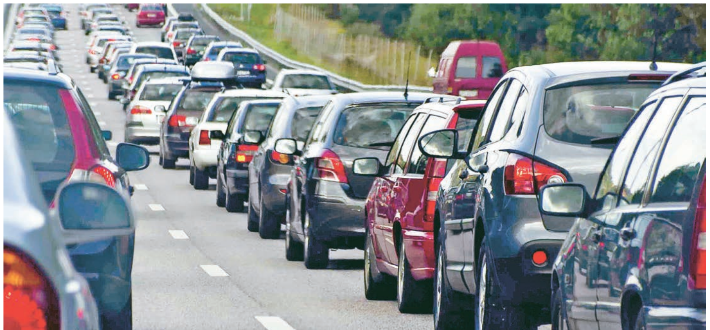
Согласно законопроекту, штраф за отсутствие техосмотра составит от 500 до 800 рублей.