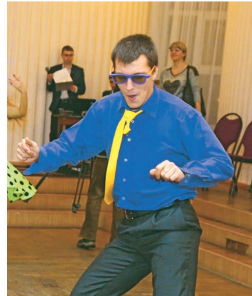
То почему бы нам с тобой не пойти потанцевать...