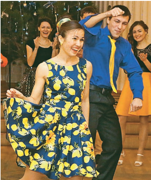
Ах, эти жёлтые лимоны!

Накануне нового 2017 года во Дворце культуры «Молодёжный» прошёл бал в стиле 60-х. Молодые металлурги танцевали твист, буги-вуги, зажигали под рок-н-ролл!