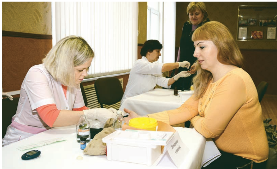
В общей сложности около 20 тысяч человек находятся под наблюдением «ЛебГОК-Здоровье».

Впервые в российской практике по инициативе медслужбы