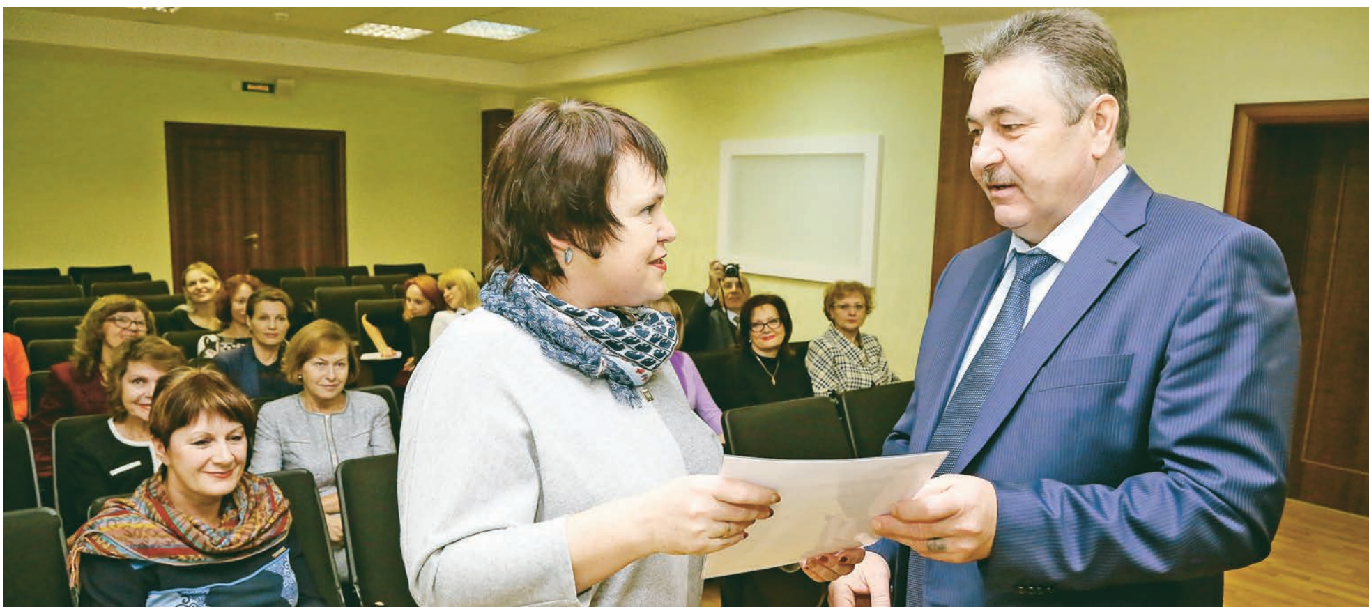
Преподаватели считают, что по результатам стажировки можно скорректировать научное направление своей деятельности и, несомненно, повысить качество преподавания.