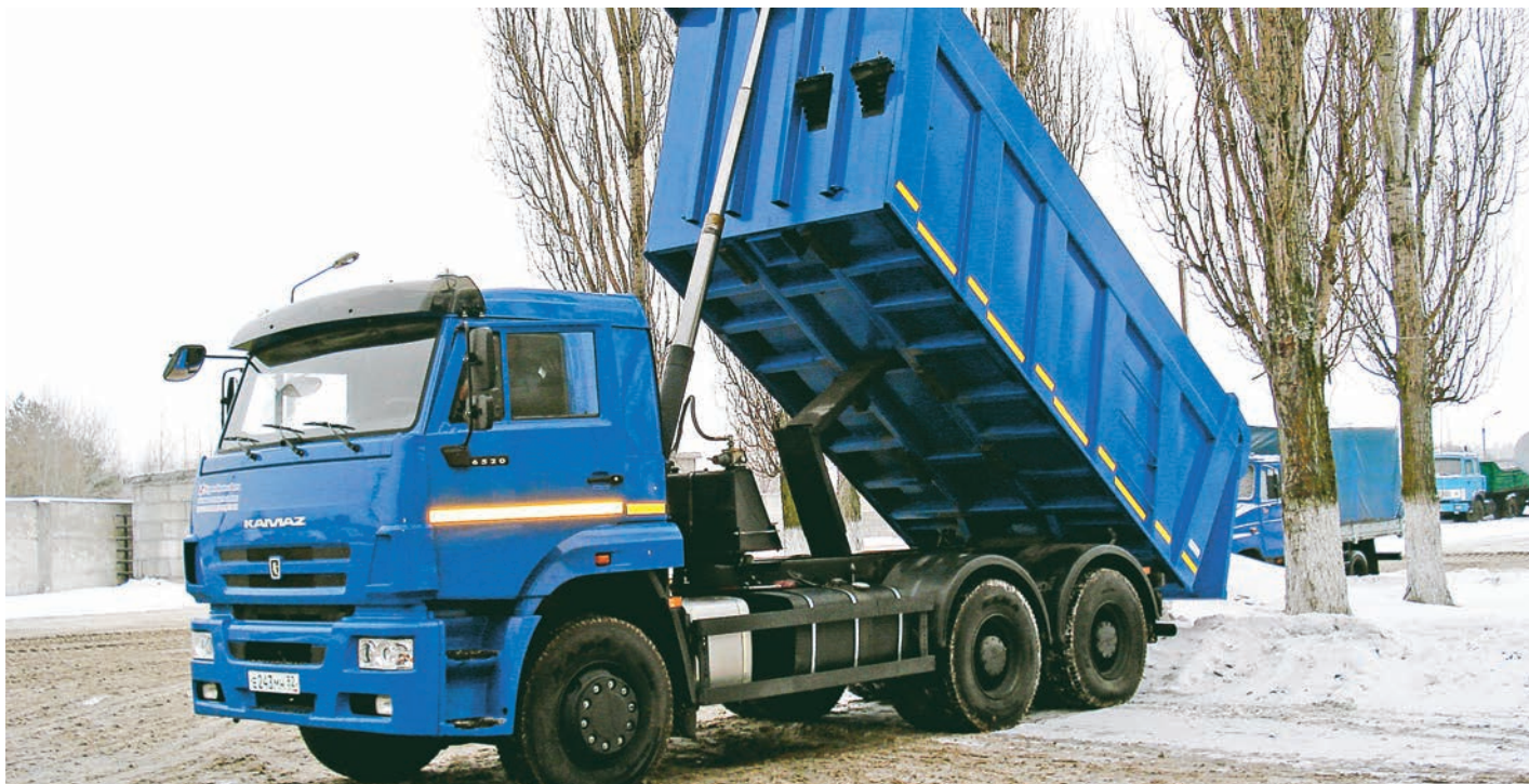
На этой модели КамАЗа увеличена мощность двигателя до 400 лошадиных сил, установлена более надёжная коробка передач.