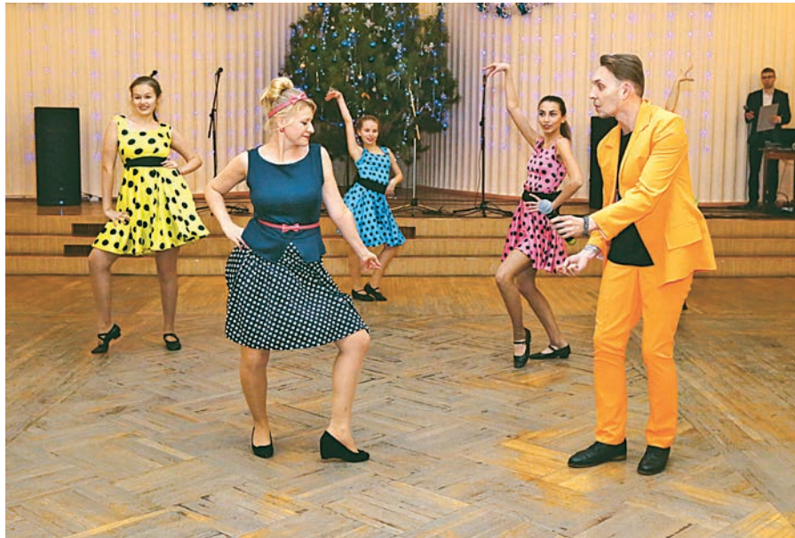
И если ты не знаешь, чем вечер занять...