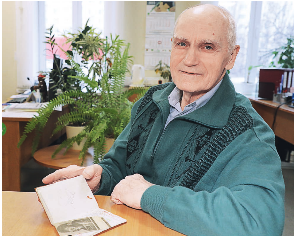
◀ Михаил Еремин на- всегда запомнил встречу с Пеле