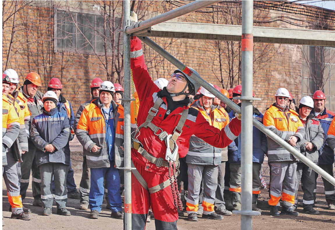
▲ Диагональные балки — одно из условий устойчивости конструкции лесов

Помимо привычных каски, очки, спецодежды и ботинок, у «высотников» есть целый набор специализированных СИЗ: страховочные привязи, канаты и стропы, анкерные линии, блокирующие устройства. И каждый элемент этого «арсенала» требует индивидуального подхода.