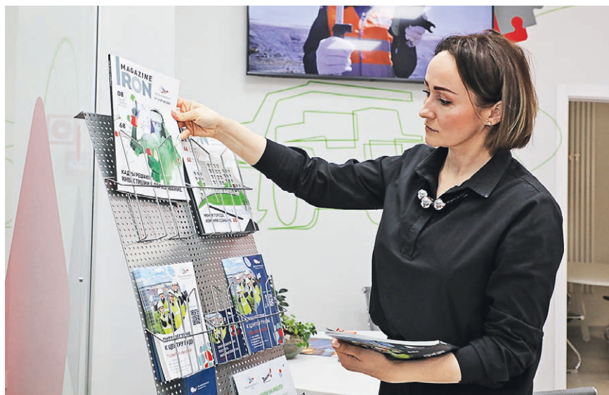
▲ Утро в офисе начинается с размещения информационных материалов на стойке и включения телевизора с видеороликами о деятельности компании

Поправляют образцы продукции на выставочном стенде и размещают брошюры на стойку.