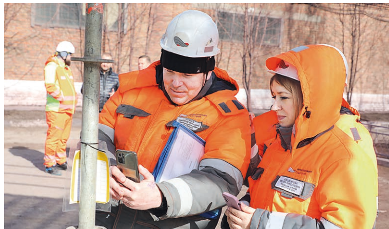
▲ После сборки на леса вешают бирку одного из трёх цветов — зелёного, жёлтого или красного. Жёлтый означает, что работа на них разрешена при соблюдении определённых условий