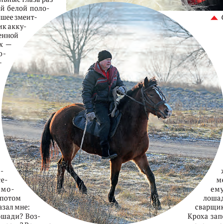
▲ Каждый день лебединец выезжает на конную прогулку