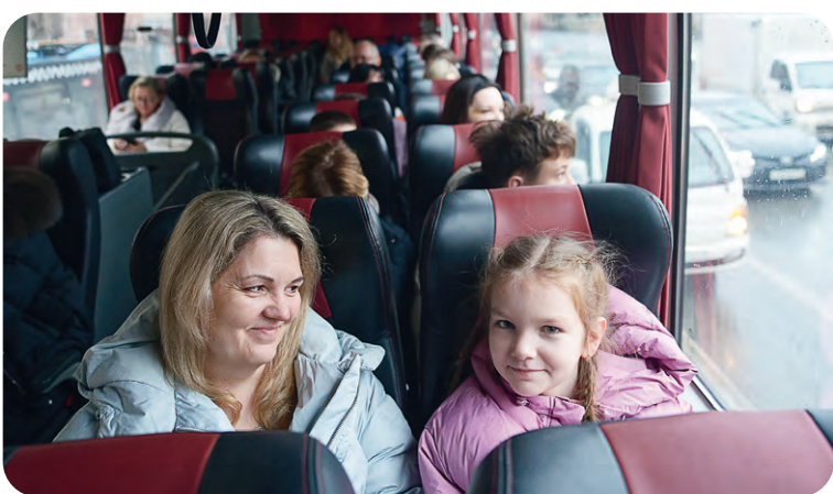
▲ Компания оплатила комфортабельные автобусы для перемещения по столице. Участников сопровождали сотрудники ГИБДД, так что движение по дорогам Москвы было максимально безопасным