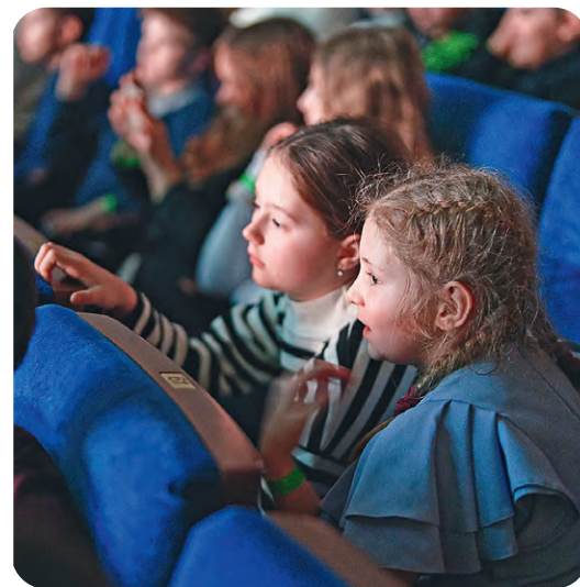
▲ В зрительном зале — искреннее сопереживание героям и ожидание чуда