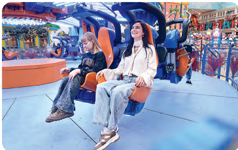
▲ На «Острове Мечты» исполнились желания и взрослых, и детей: весёлого полёта и лёгкой посадки в этот день желали многим!