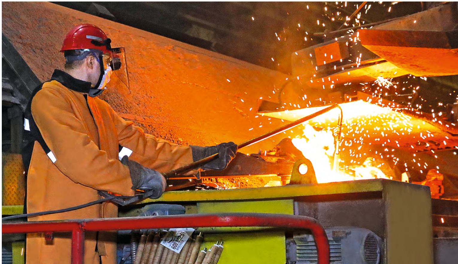
▲ При замере температуры металла разлищик стали чувствует себя комфортно в такой спецодежде

В электросталеплавильный цех закупили 50 термоогнестойких костюмов