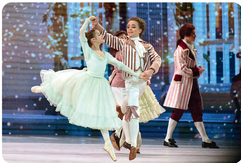
▲ На сцене — юные воспитанники Академии русского балета имени А. Я. Вагановой