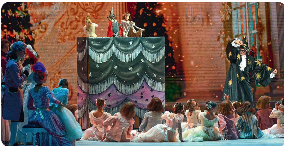
▲ Начало спектакля. Скоро куклы оживут под Рождественской ёлкой, и начнётся главное действие