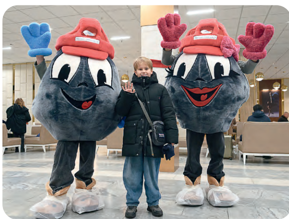
▲ В фойе гостиницы гостей встречают Окатыши. Праздник начинается!